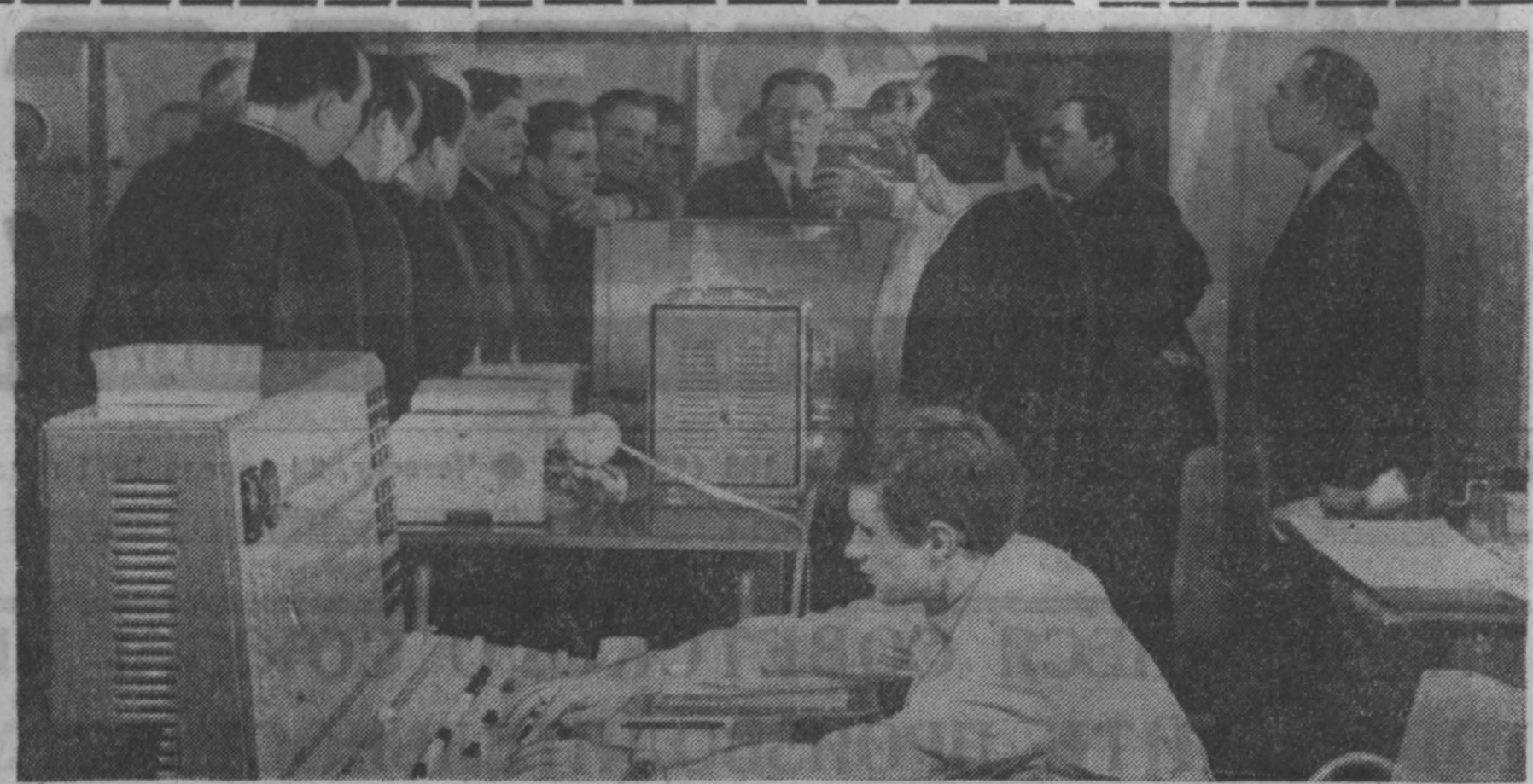
КАК РАБОТАЕТ АСУ?