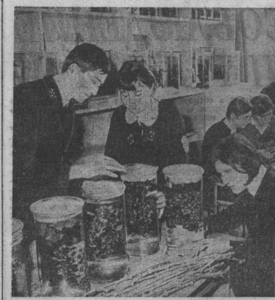
БОЛГАРИЯ. Учебно-опытная база в Плевне — старейшая не только в стране, но и на всем Балканском полуострове. Здесь идет подготовка будущих виноградарей. НА СНИМКЕ: на практических занятиях.

Все больше общественных организаций выражают поддержку правительству объединенного фронта в борьбе с мятежниками.