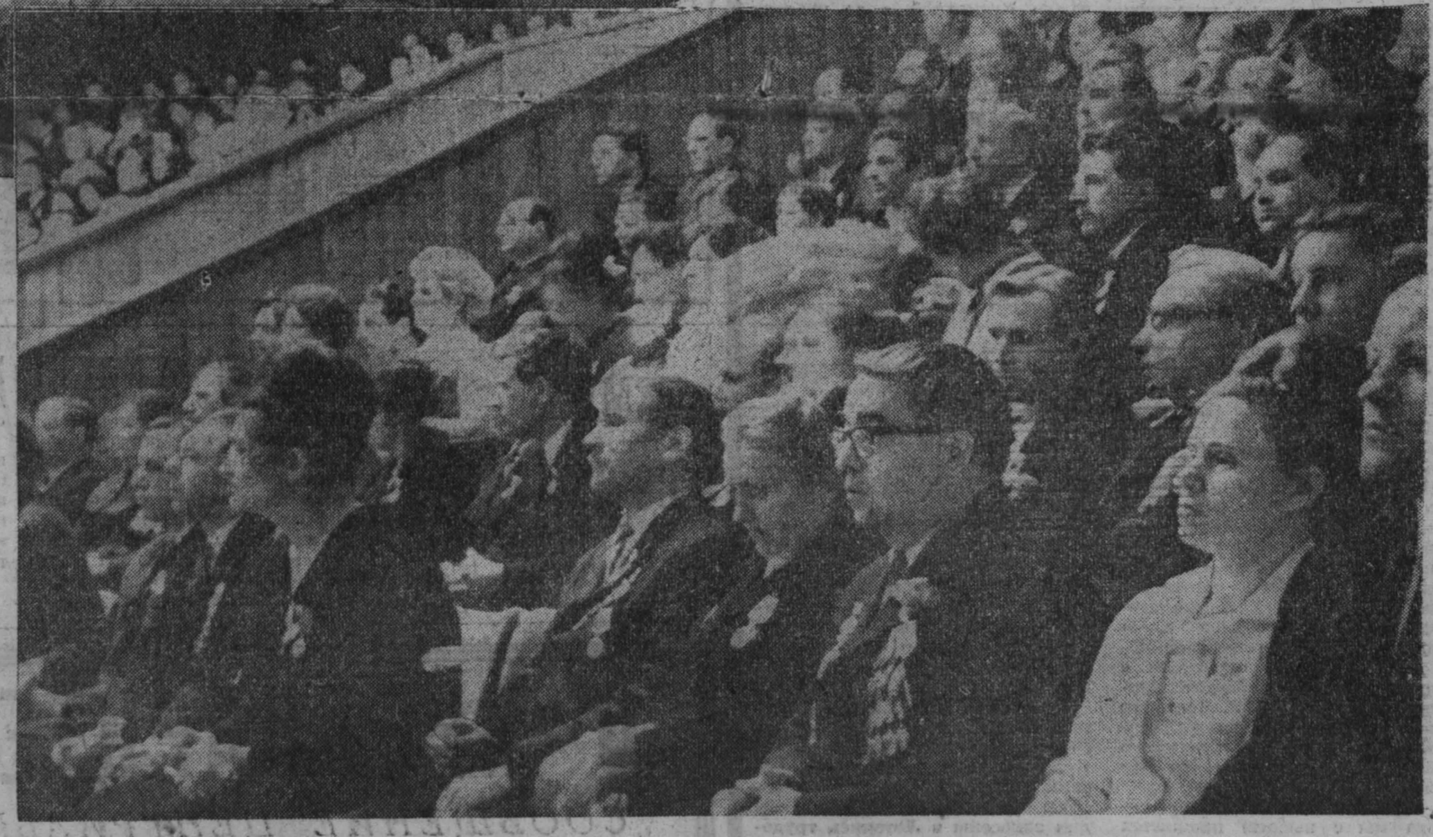
НА СНИМКАХ: торжественное заседание в Кемерове, посвященное 100-летию со дня рождения В. И. Ленина.