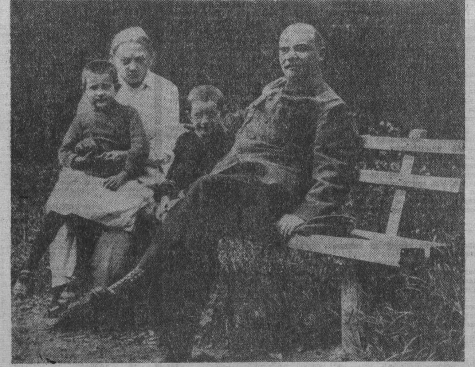
В. И. Ленин и Н. К. Крупская с племянником Лениным Виктором и дочерью рабочего Верой в Горках. Август-сентябрь 1922 года.