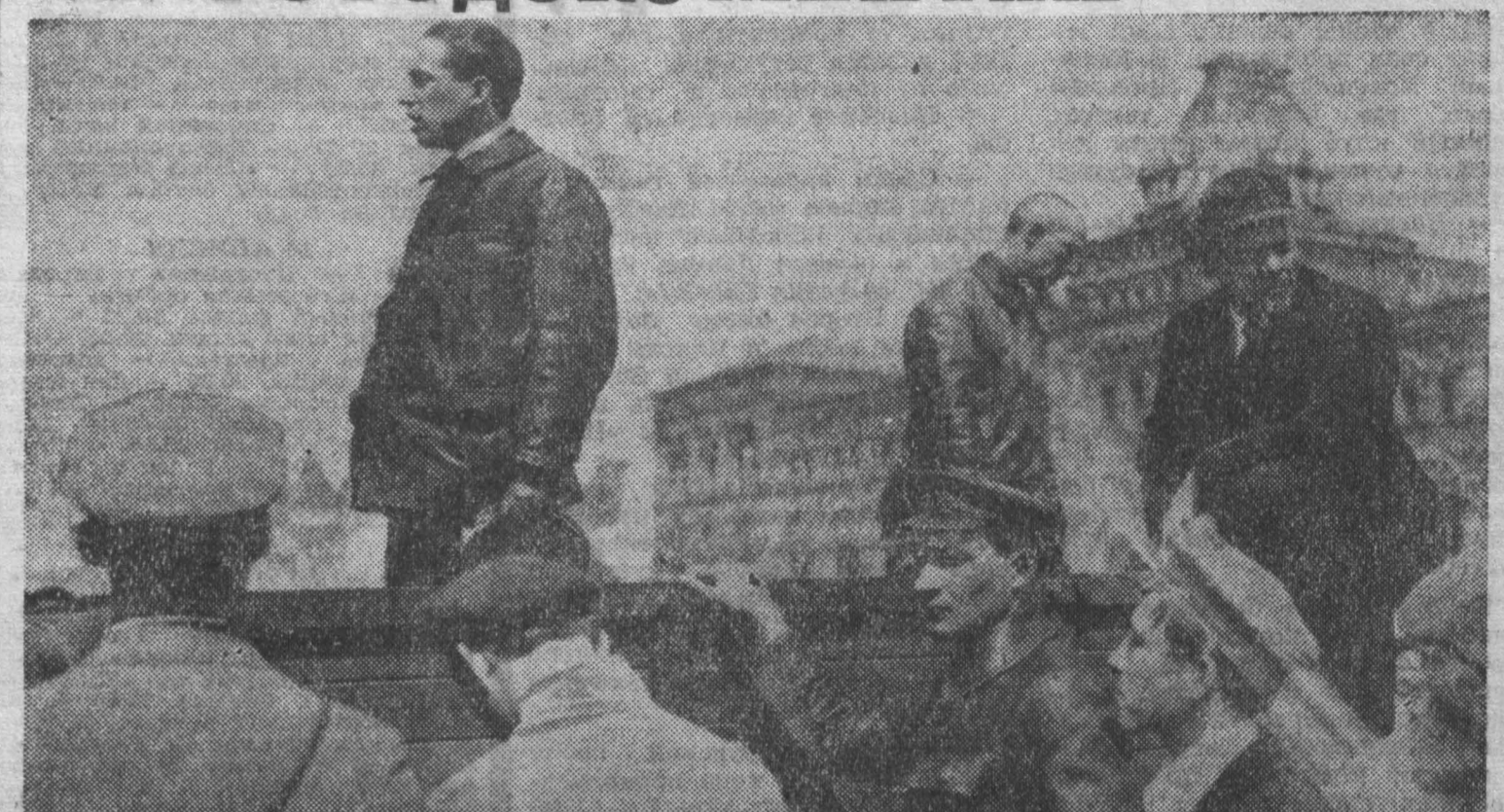
В. И. Ленин на Красной площади во время праздника войск Всевобуча. Речь произносит Т. Самуэли. 1919 г. 25 мая. Москва.