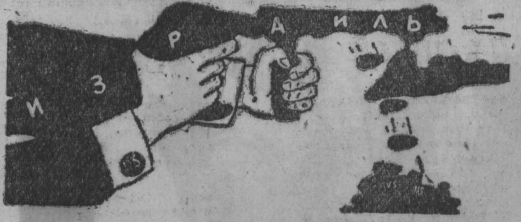
Оружие мирового империализма. (Карикатура из журнала «Ойленшпигель», ГДР).

спортерах вновь перешла границу Камбоджи. По словам газеты, «некоторые американские командиры» также поддерживают идею подобных вторжений на камбоджийскую территорию. Хотя, по сообщению газеты, американское посольство в Сайгоне делало вид, что «оно удивлено» актами агрессии против Камбоджи, «Нью-Йорк таймс» указывает, что о последних операциях сайгонских марionетных войск в Камбодже знали «американские военные советники».