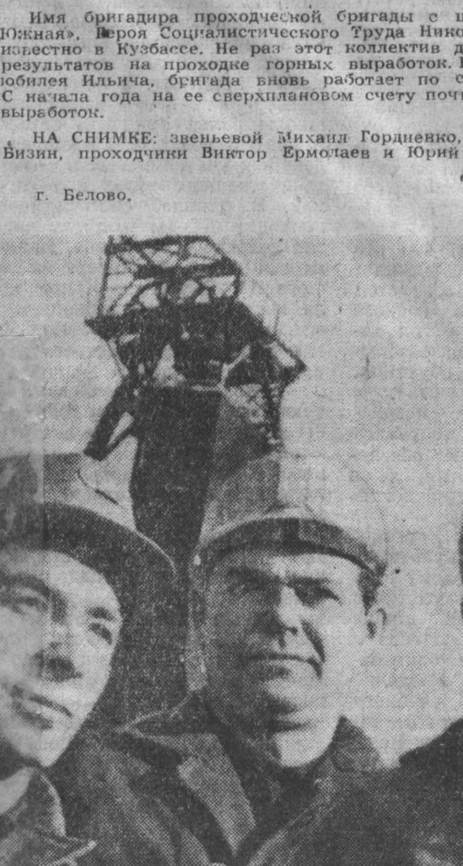
Имя бригадира проходческой бригады с шахты «Чертинская-Южная»...

У ОБЛАСТНОГО штаба студенческих строительных отрядов сейчас самая ответственная пора. Коммунисты отряды, начинаются учебные мастера, командиров и комиссаров, занятия по технике безопасности.