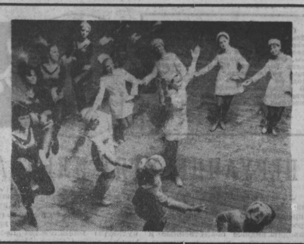
НА СНИМКЕ: сцена из эстрадного ревию «Русь-тройка».