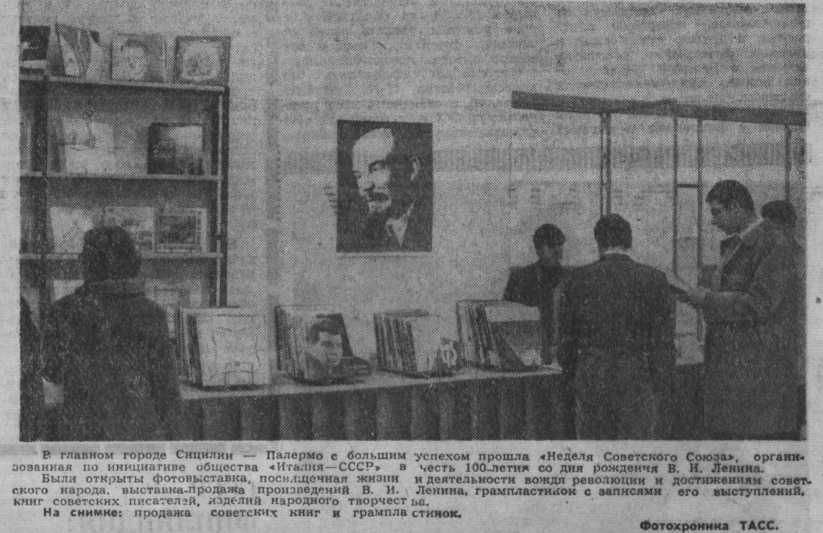
В главном городе Сицилии — Палермо с большим успехом прошла «Неделя Советского Союза», организованная по инициативе общества «Италия-СССР» в честь 100-летия со дня рождения В. И. Ленина. Были открыты фотовыставка, посвященная жизни и деятельности вождя революции и достижениям советского народа, выставка-продажа произведений В. И. Ленина, грампластинок с записями его выступлений, книг советских писателей, выставки народного творчества. На снимке: продажа советских книг и грампластинок.