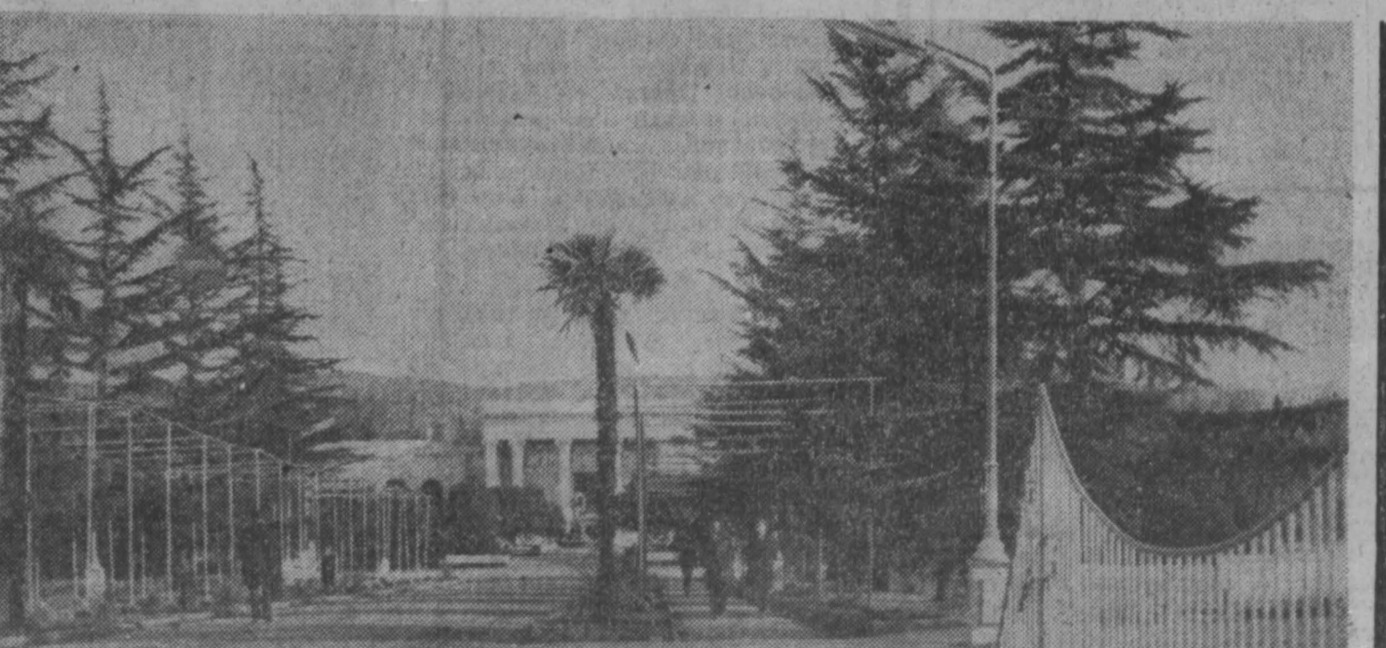
НА СНИМКЕ: важное здание в Цхалтубо.

ГРУЗИНСКАЯ ССР. Свыше 120 тысяч человек побывают в нынешнем году в санаториях и пансионатах всемирно известной здравницы — курорта Цхалтубо. Из разных уголков Советского Союза приезжают отдыхать в Цхалтубо и в эти зимние дни. Февраль, а ртутный столбик показывает 15—18 градусов тепла. Сейчас в 15 благоустроенных санаториях курорта отдыхают и поправляют здоровье рабочие из Москвы и Ленинграда, шахтеры из Донбасса, хлороборцы из Узбекистана, заводские металлурги, астраханские рыбаки, уральские машиностроители, нефтяники из Бaku и др.