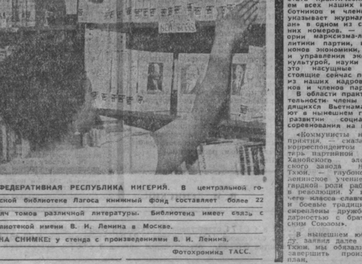
ФЕДЕРАТИВНАЯ РЕСПУБЛИКА НИГЕРИЯ. В центральной городской библиотеке Лагоса книжный фонд составляет более 22 тысяч томов различной литературы. Библиотека имеет связь с библиотечной имени В. И. Ленина в Москве. НА СНИМКЕ: у стенда с произведениями В. И. Ленина.