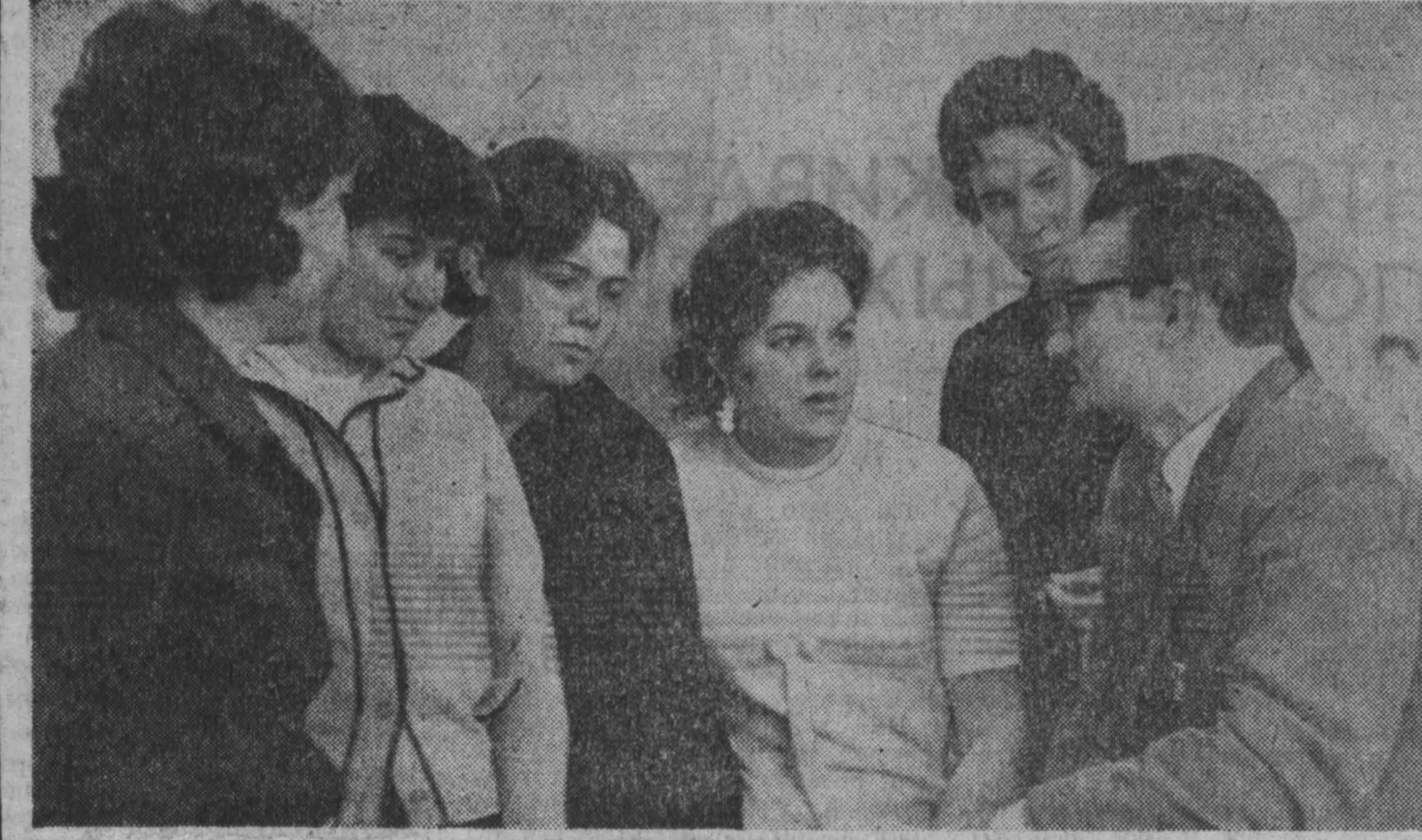
В Кемерове продолжается семинар работников книжной торговли Сибири и Дальнего Востока. На нем обсуждаются задачи издательства на юбилейный год.