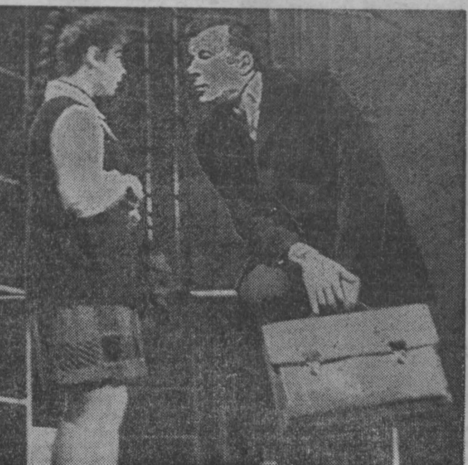
Спектакль «Должники» — новая пьеса молодого драматурга Леонида Жуховицкого. В прошлые сезоны в областном театре шла его пьеса «Возраст расплат».