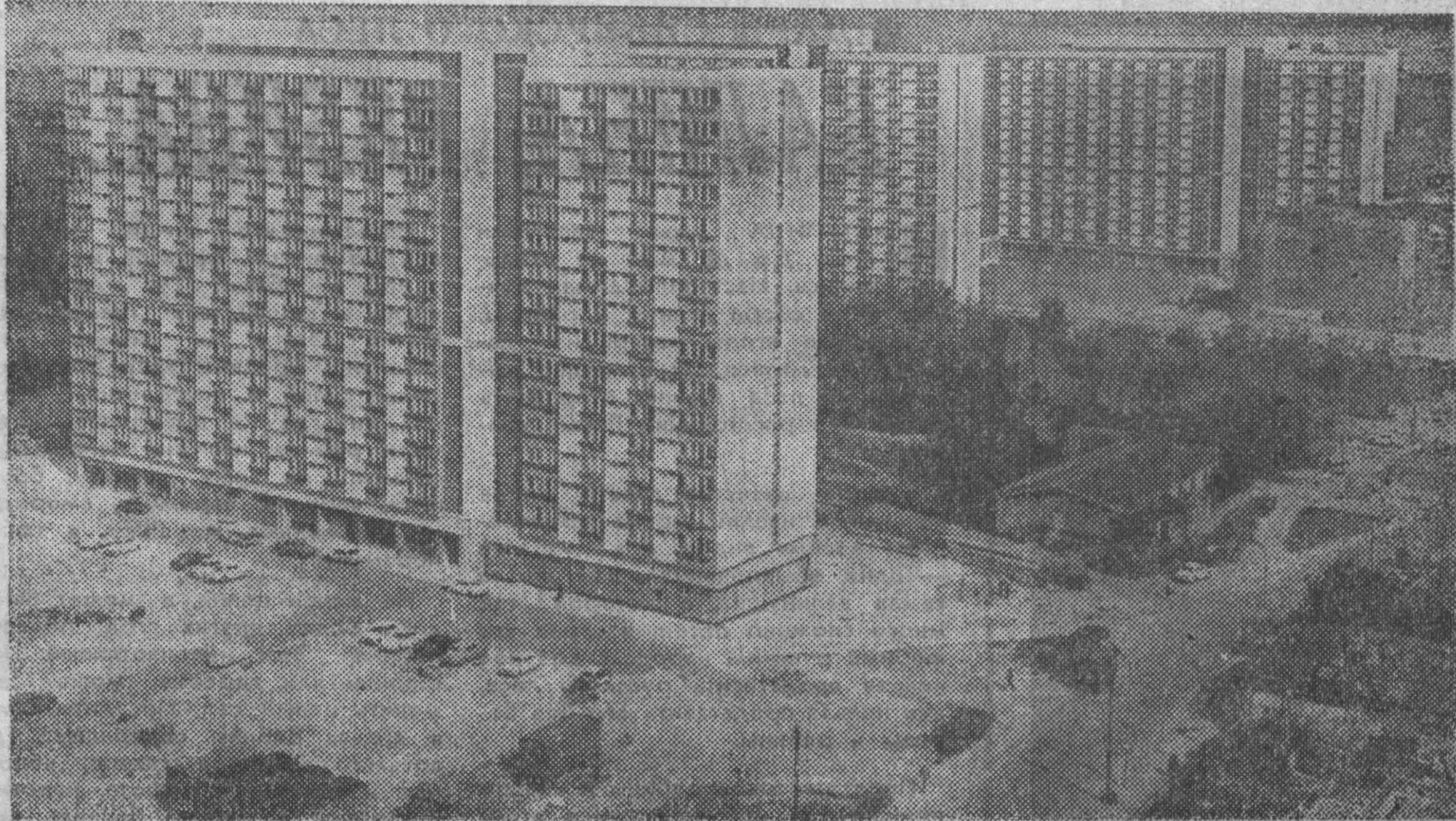
В синеве неба — белые всплески электросварок. Строительные краны вытягивают длинные шест, словно ведут переключку. Величаво, как по конвейеру, на большой высоте плывут бетонные плиты и стены домов. Так выглядят новостройки Варшавы, вставшей после войны из руин и пепла. Этаж за этажом поднимаются красивые жилые дома и целые кварталы в городе на Висла. Сейчас в нем несколько тысяч строительных площадок. 14 тысяч семей варшавян справят в этом году возовосле. Уже давно в польской столице значительно больше жилья, чем было в ней перед войной, а площадь городской застройки увеличилась втрое. Большое строительство в эти дни ведется в центре Варшавы. В районе «За железным Брамом», там, где всегда была аристократическая часть города, растет массив из современных 16-этажных домов. В них будут жить рабочие и служащие народной Польши. НА СНИМКЕ: на строительстве жилых домов в районе «За железным Брамом».

ХАНОИ, 14 декабря. (ТАСС). Американские войска за период с 1961 по 1969 год распылили в Южном Вьетнаме ядохимикаты над 13 тыс. квадратных километров посевных площадей и 25 тыс. квадратных километров горных районов и джунглей, в результате чего получили отравления 1 миллион 300 тысяч человек. За первые девять месяцев этого года, сообщает агентство печати Освобождение, химические вещества были распылены над 25 провинциями Южного Вьетнама. Приведены в годотчет 415 тыс. гектаров земель, получили отравления 185 тысяч человек, 300 из которых умерло.