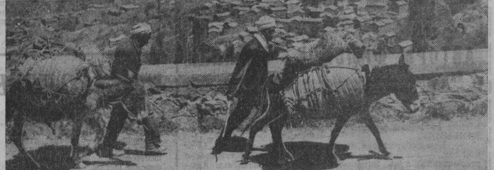
МАЛАЯ КАБИЛИЯ — живописнейший район Алжира. Расположенная в труднодоступной части Атласских гор, эта область являлась одним из центров народно-освободительной борьбы алжирского народа против колонизаторов.

НА СНИМКЕ: сельский пейзаж Малой Кабилии.