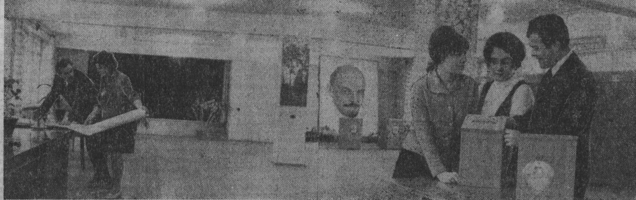
Этот снимок сделан вчера на избирательном участке № 62 по выборам в народный суд. Сегодня здесь голосуют жители проспекта имени Ленина и улицы Спортивной.

Орденом Трудового Красного Знамени награждено 44 человека, орденом «Знак Почета» — 79, медалью «За трудовую доблесть» — 87 и медалью «За трудовое отличие» — 83 человека. Указ публикуется в «Ведомостях Верховного Совета СССР».