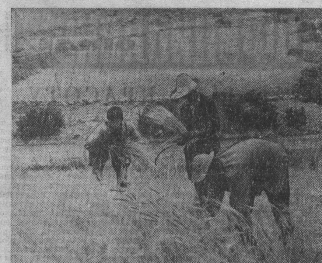
АЛЖИР. Уборка ячменя в предгорьях Малой Кабилии (департамент Сетиф). Много упорства, энергии и терпения каждогодневного труда приходится прилагать жителям этого края, чтобы вырастить на усыпанных камнями горных террасах урожай сельскохозяйственных продуктов.

Излагая речь Л. И. Брежнева, чехословацкие радио особо отметили, что суть советской внешней политики состоит в защите интересов социализма, в поддержке освобождения борьбы народов, в последовательном отстаивании принципа мирного сосуществования государств, в укреплении мира и дружбы между народами.