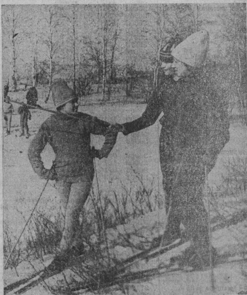
На лыжной прогулке.

ШАХТУ мы узнаем сразу, по черному дымящемуся конусу породного террикона. А ночью на вершине горы мелькают, перебегая, синие огоньки. Для постороннего черный террикон — индустриальный пейзаж, экизотика. А для жителей городского города это коварный и острый нежелательный сосед. Терриконы, подобно вулканам, день и ночь дышат изнутри углекислотой, отравляя воздух, занимают большие площади на поверхности и скопывают добычу угля под собой. Например, под одним только терриконом Киселевской шахты им. Вахрушева лежит более 2 млн. тонн отличного топлива. А подступиться к нему нельзя из-за постоянной угрозы подземного пожара, которую всегда создает под собой породный конус. У горняков Киселевских таких опасных соседей пятнадцать.