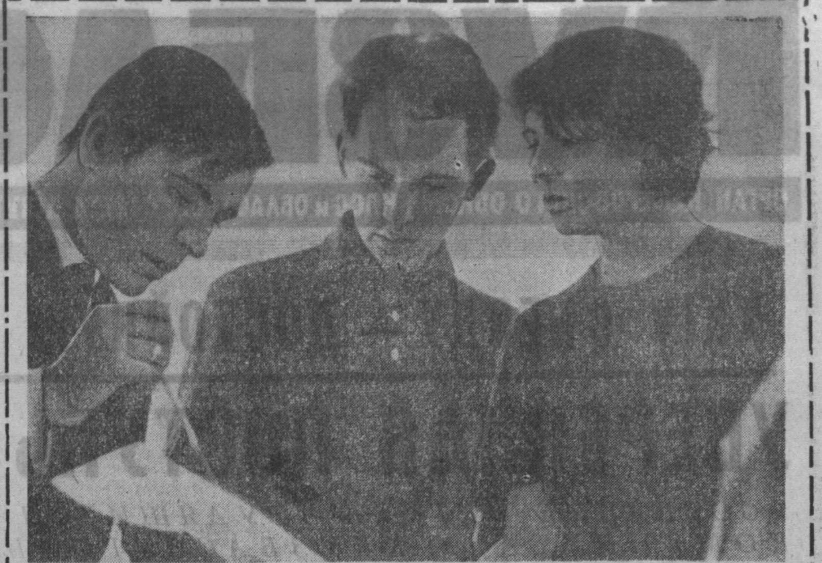
НЕДАВНО в Горной Шории вступил в строй мощный ретранслятор. Жители самого южного города Кузбасса — Таштагола и окрестных поселков начали регулярно смотреть программу Кемеровского телевидения. Качество передач с каждым месяцем улучшается. И в этом заслуга коллектива, обслуживающего ретранслятор.