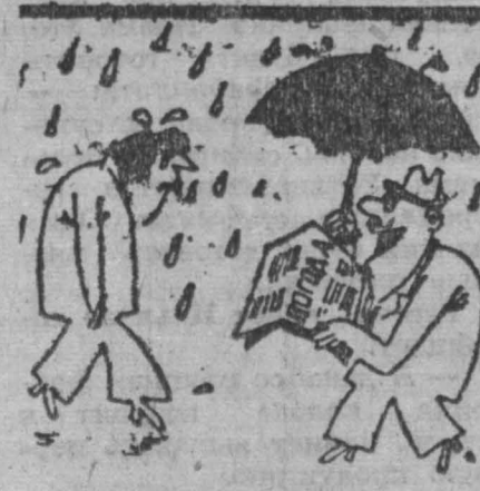
«Кузбасс» надо выписывать, молодой человек.

На ее участке каждая семья в будущем году будет получать по 7-9 периодических изданий. Н. ВАСИЛЬЕВ, г. Прокопьевск.