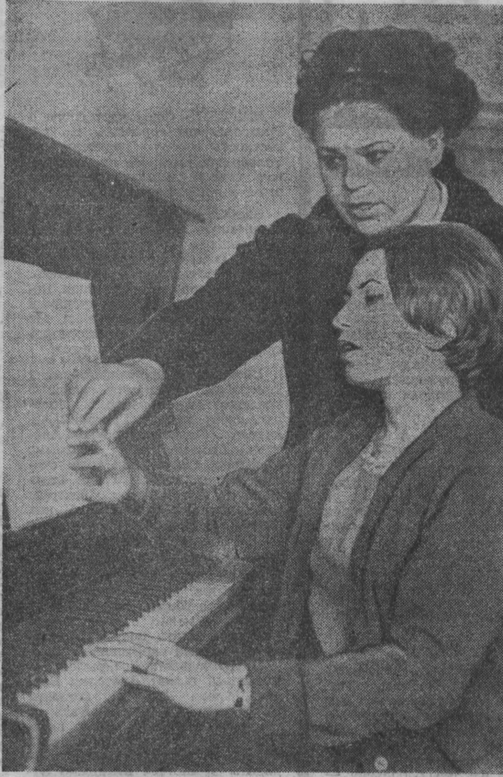
НОВОКУЗНЕЦКОМУ педагогическому училищу № 1 исполнилось четверть века. За эти годы из его стен вышло более трех тысяч учителей начальных классов, сотни преподавателей музыки и физического воспитания.