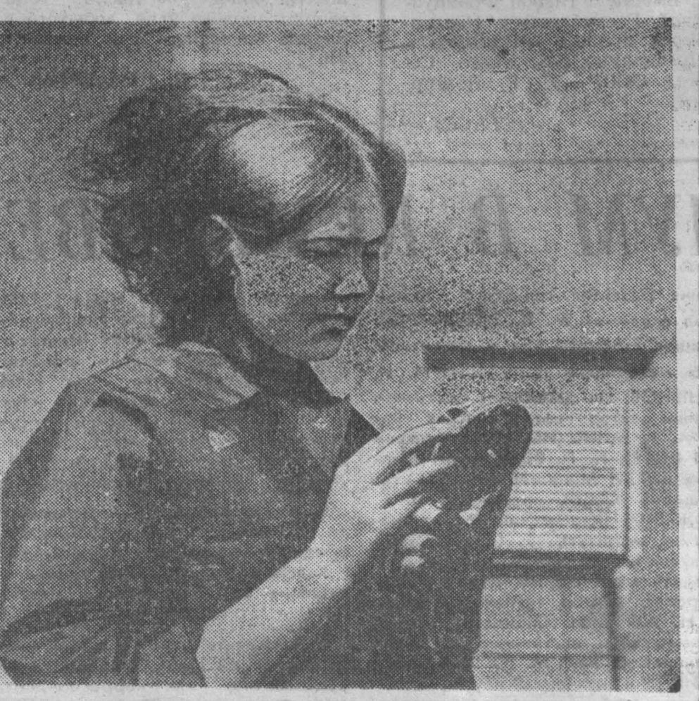
В. КУРКОВ, внештатный корр. «Кузбасса».