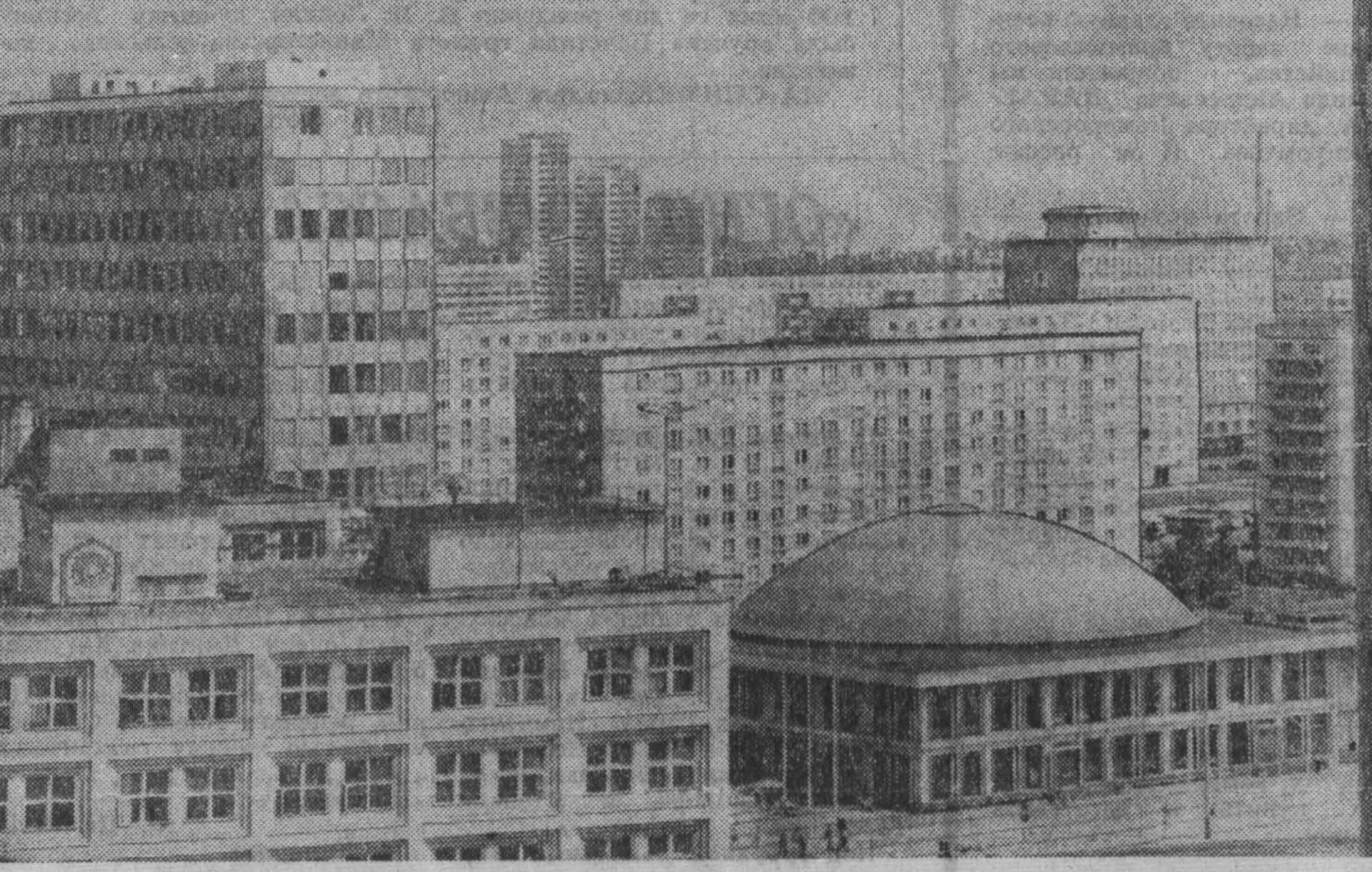
Совершенно новый облик центра Берлина с его красивыми многоэтажными домами убедительно свидетельствует о тех больших изменениях, которые произошли в столице ГДР за последние годы. В городе ведется большое жилищное строительство, сооружаются административные здания и культурно-бытовые учреждения.

Как известно, ранее в Гвинею была арестована группа заговорщиков, которые должны были вызвать в стране беспорядки. Эти заговорщики были брошены в Гвинею с территории португальской колонии Гвинея (Бисау), где они прошли специальную подготовку.