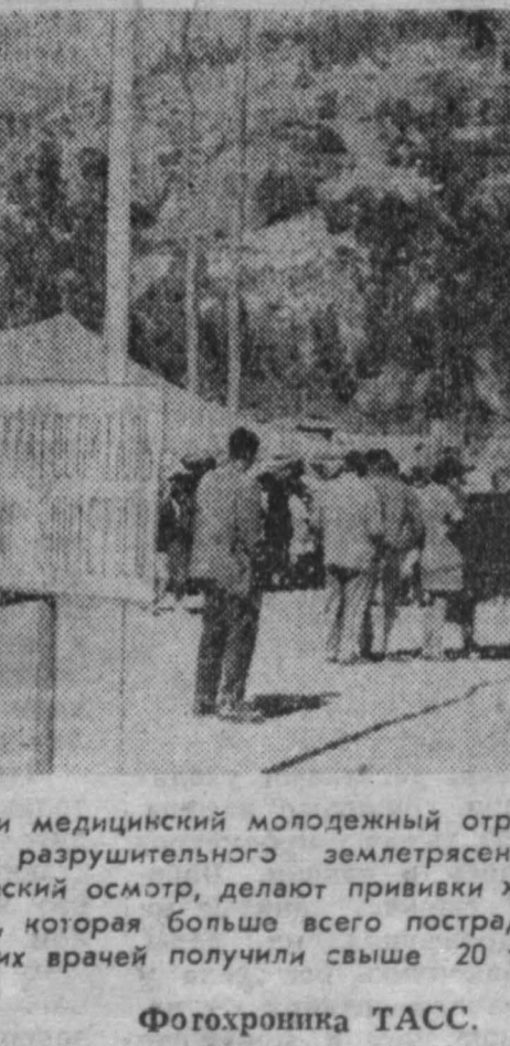
Уже более месяца работают в Перу советский головной госпиталь и медицинский молодежный отряд, грибовичи в эту страну для оказания помощи пострадавшим от разрушительного землетрясения. Советские специалисты проводят сложные операции, ведут профилактический осмотр, делают прививки жителям самых отдаленных населенных пунктов долины Кальхон-де-Уайлас, которая больше всего пострадала от стихийного бедствия. За это время медицинскую помощь от советских врачей получили свыше 20 тысяч перуанцев.

Бригада рекордсменов оснащена советским горнопроходческим оборудованием. Свои достижения молодые горняки посвятили 50-летию КПС.