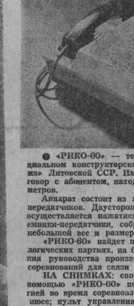
«РИКО-60» — телефон без проводов, созданный в специальном конструкторском бюро оргтехники объединения «Сигма» Лигонской ССР.