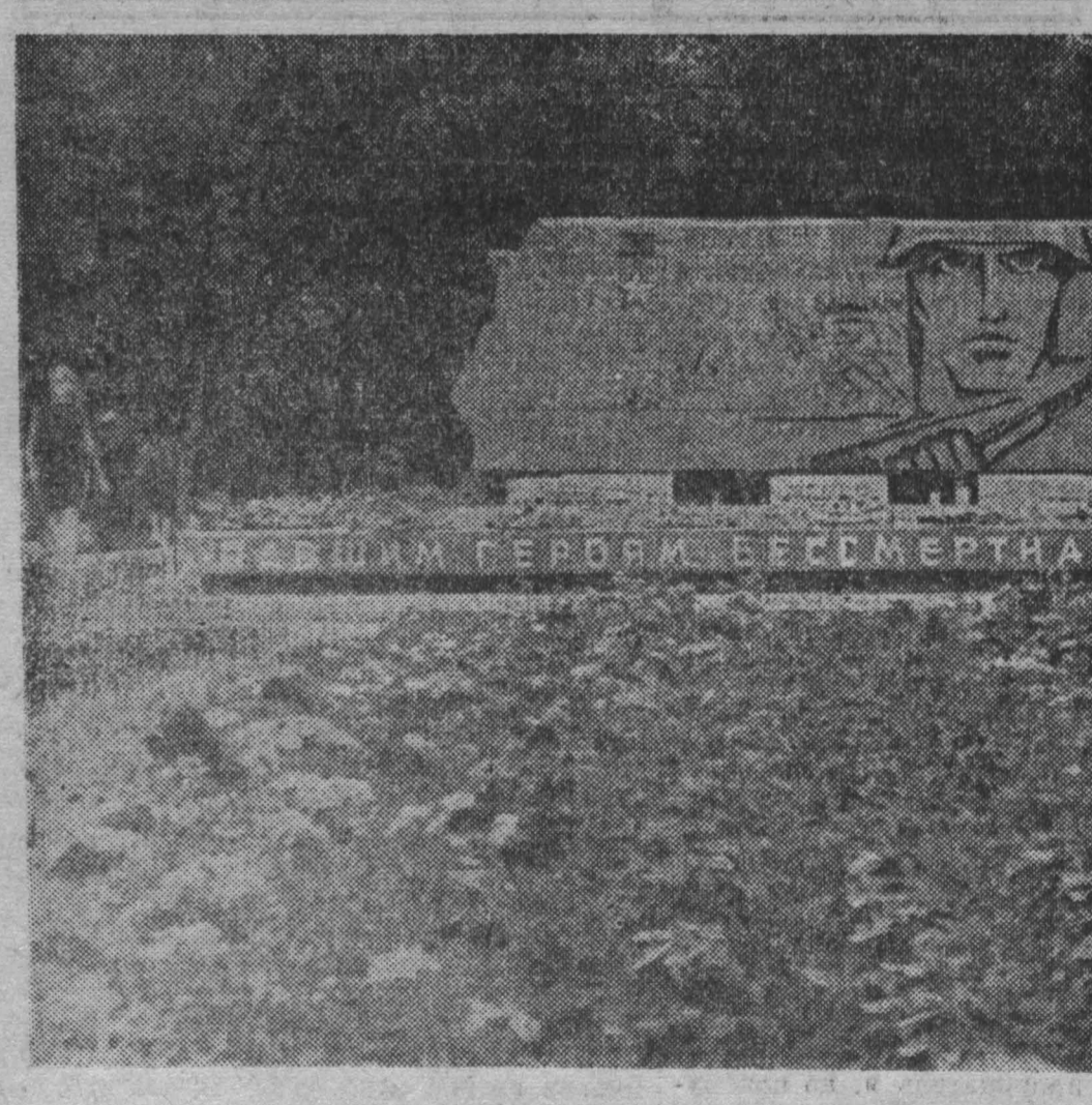
Фотомонтаж: Герой Бессмертная слава