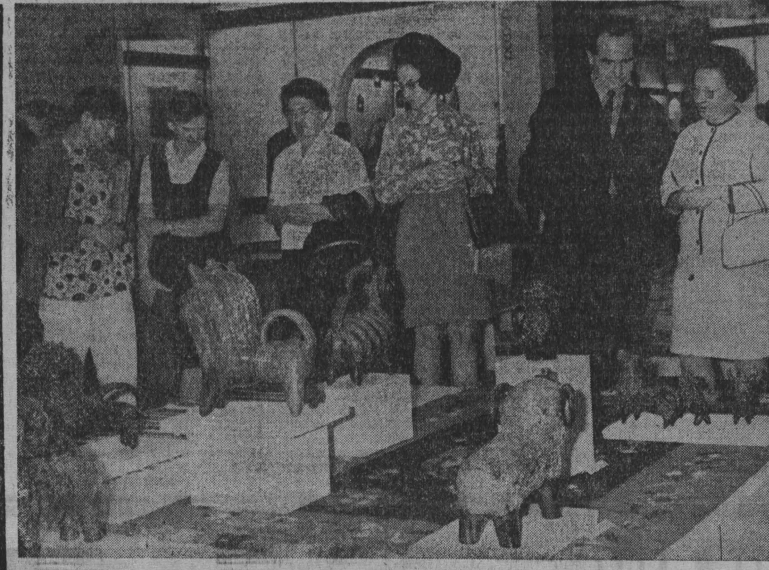
МОСКВА. В Центральном выставочном зале открыта Всесоюзная выставка декоративно-прикладного искусства.