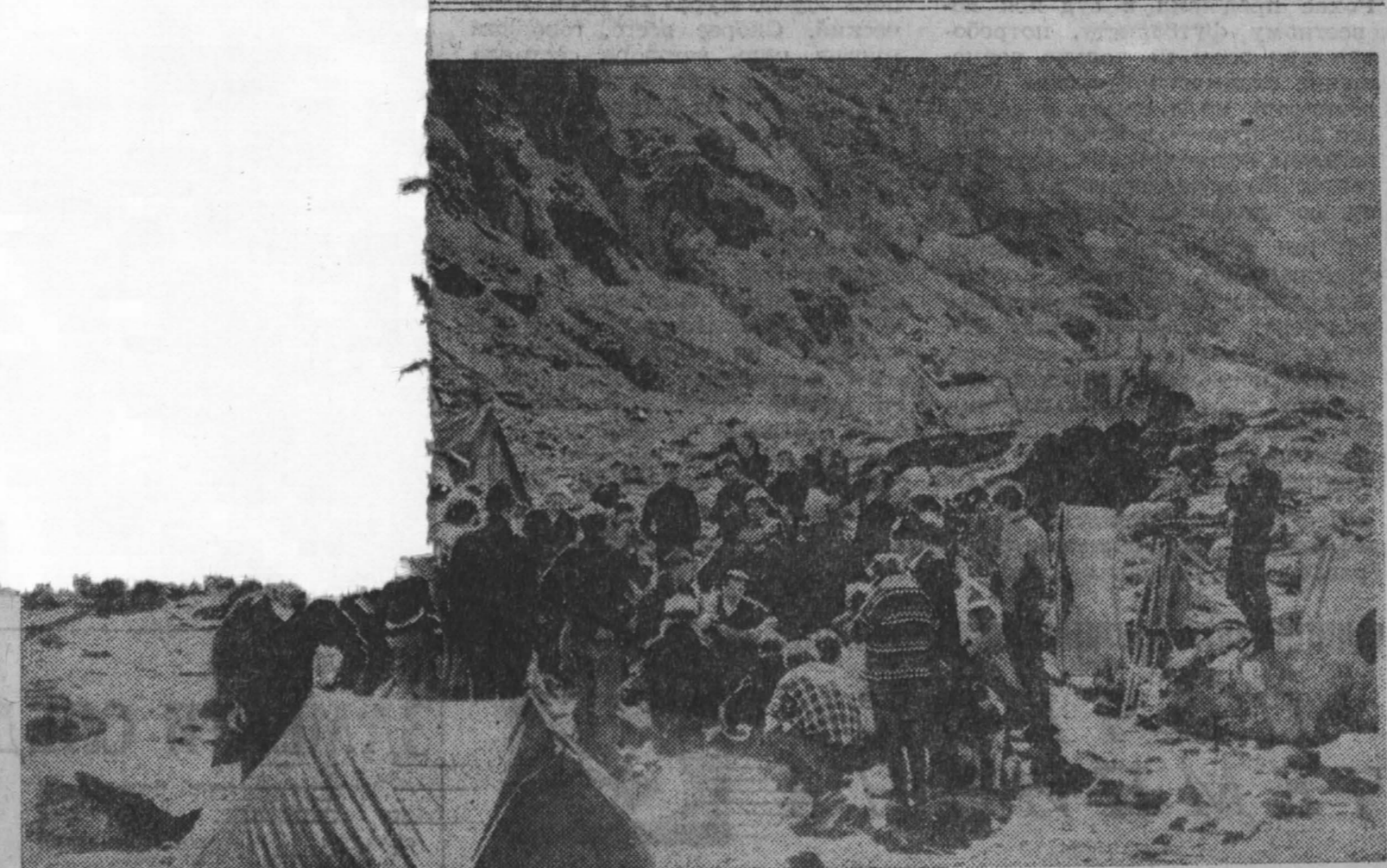
Оригинальную демонстрацию устроили норвежцы неподалеку от известного в Северной Европе водопада Мардаллсфоссан, где начинается строительство электростанции.

Во-вторых, даже если какая-либо компания пожелает по собственной инициативе принять меры по защите окружающей среды, например построить дорожбесто-