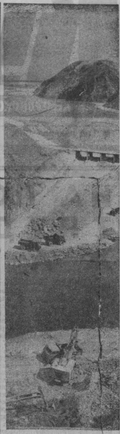
КИРГИЗСКАЯ ССР. На реке Гелес продолжается строительство Киргизского водохранилища — одного из крупнейших в Средней Азии. Оно позволит оросить десятки тысяч гектаров засушливых земель. Сейчас на строительной площадке ведется обработка склонов под теле будущей плотины. НА СНИМКЕ: общий вид строения.

Срок ввода комплекса в действие одинаков был уже сорван. И если монтажные и ближайшие сроки не будут работать с полной нагрузкой, то и в этом году стройка не будет закончена. Кстати, вину за срыв первого срока генподрядчик «Юргпромстрой» на заказчика, якобы не поставившего своевременно оборудования.