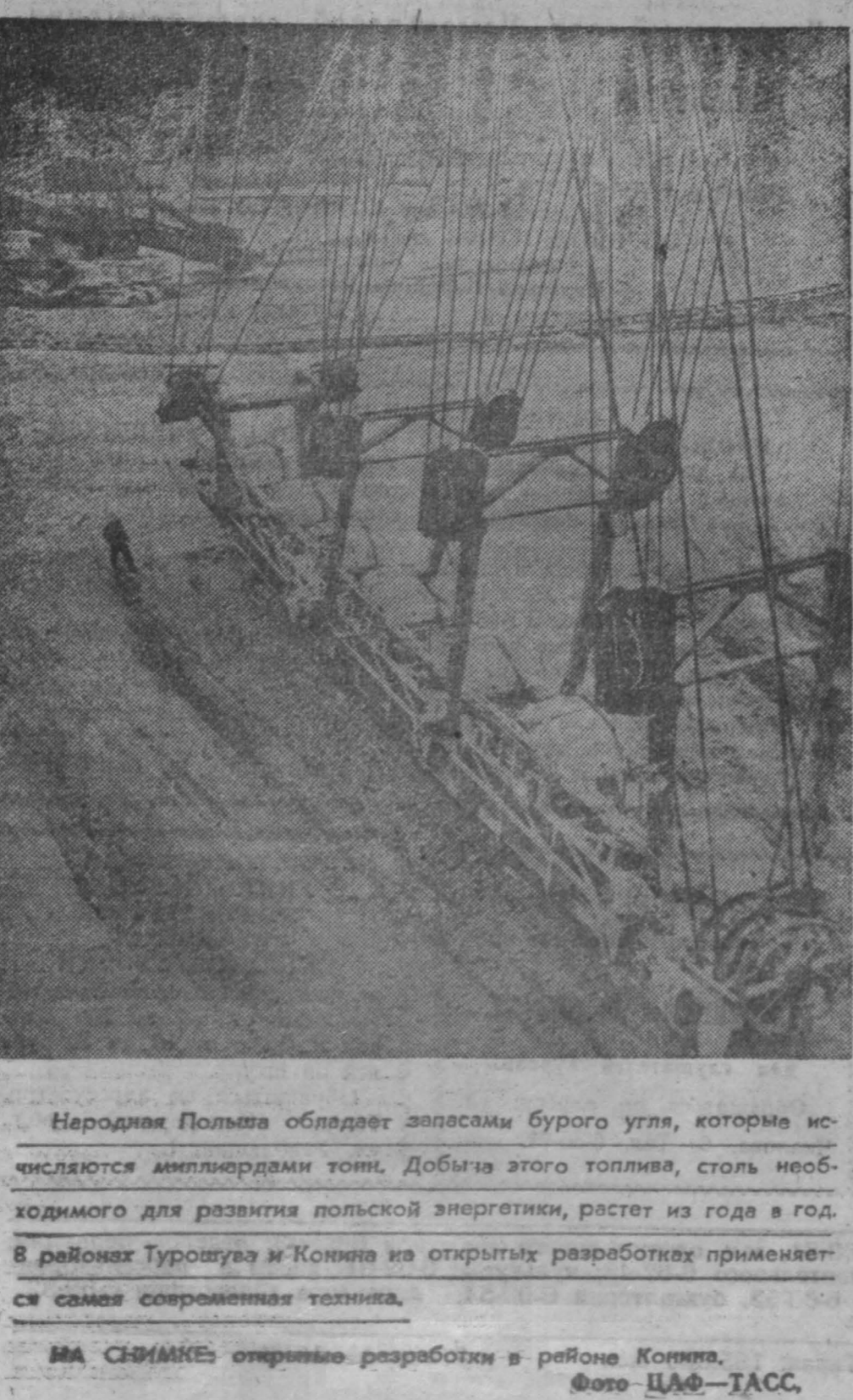
Неродная Польша обладает запасами бурого угля, которые исчисляются миллиардами тонн. Добыча этого топлива, столь необходимого для развития польской энергетики, растет из года в год. В районах Гурова и Конины из открытых разработок применяются самые современные технологии.

Под нажимом правительства и военно-промышленного комплекса сенаторы большинством голосов отвергли предложение республиканца Э. Бруна ограничить развертывание системы «Сейфирга» двумя пусковыми площадками, строительство которых было одобрено еще в прошлом году.