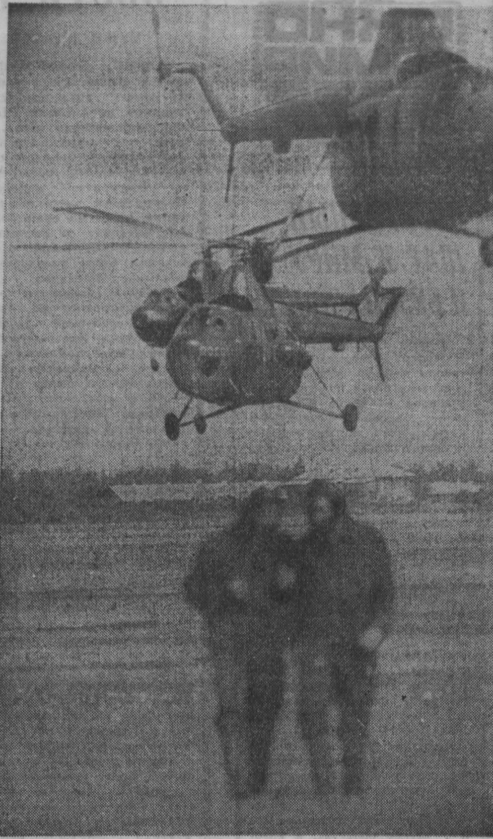
Десятки юношей и девушек осваивают технику самолетов и вертолетов, познают искусство прыжков с парашютом в Кемеровском аэроклубе ДОСААФ.

Эти снимки сделаны в канун Дня Воздушного Флота СССР на занятиях спортсменов-вертолётчиков.