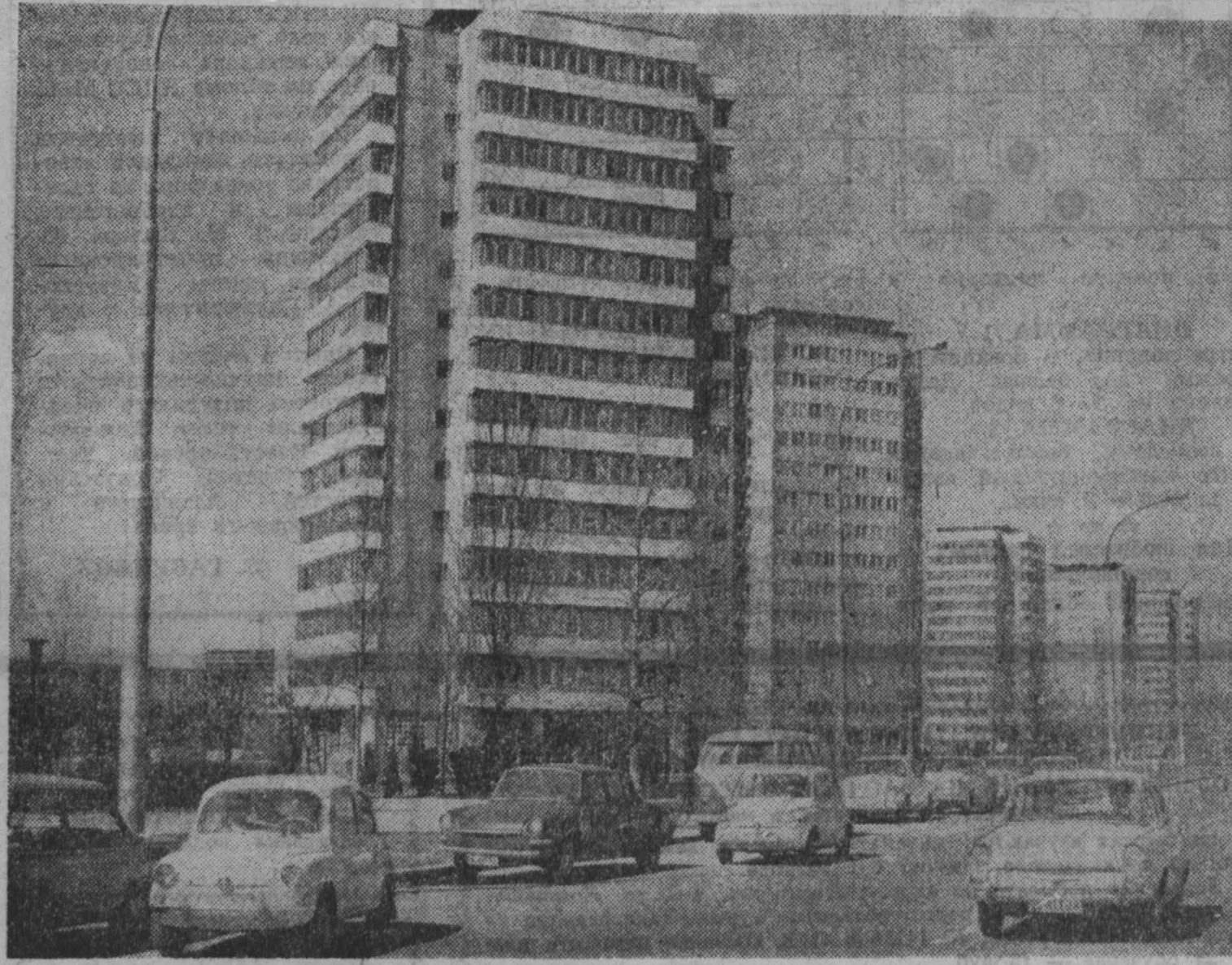
СФРЮ. Бульвар имени Владимира Ильича Ленина в новом районе югославской столицы — Новом Белграде.

гах буржуазной оппозиции. Представители этих кругов, в том числе бывший посол Испании в Париже, посетили генерального прокурора верховного суда Эррера Техедора и вручили ему заявление, в котором констатируют «справедливость» требований рабочих Гранады. Авторы заявления отмечают, что атмосфера насилия сохранилась в Гранаде вследствие позиции предпринимателей, которые заручились поддержкой властей.