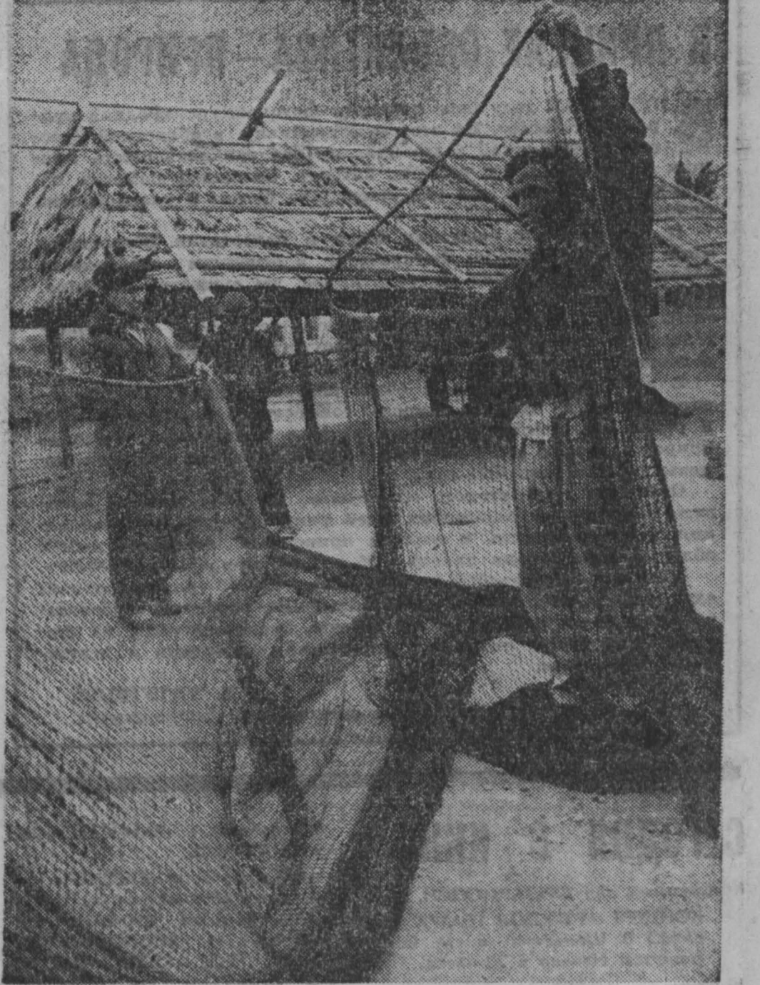
ДРВ. Из года в год рыбаки сельскохозяйственного кооператива села Зеняк в провинции Хайфон увеличивают улов рыбы. За достигнутые успехи рыбацкому кооперативу присуждено первое место в Красном знаме. НА СНИМКЕ: проверка сетей перед выходом в море.