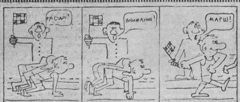
Рис. Г. Ефремова.

25 лет назад в Москве был подписан Договор о дружбе, сотрудничестве и взаимной помощи между Советским Союзом и Польшей. Знаменательному событию Министерство связи СССР посвятило новую почтовую марку. На миниатюре номиналом в шесть копеек изображены фигуры советского и польского рабочего на фоне государственных флагов СССР и ПНР. Перед собой они держат шт. Надпись на нем гласит: «25-летие Договора о дружбе, сотрудничестве и взаимной помощи между СССР и ПНР». Марка выполнена способом глубокой печати в серо-синем и красном цветах. Размер 28 на 40 миллиметров. Зубовка гребенчатая. Автор рисунка художник Юрий Левинский. По каталогу № 3950. Л. ТРАВКИН. (АПН).