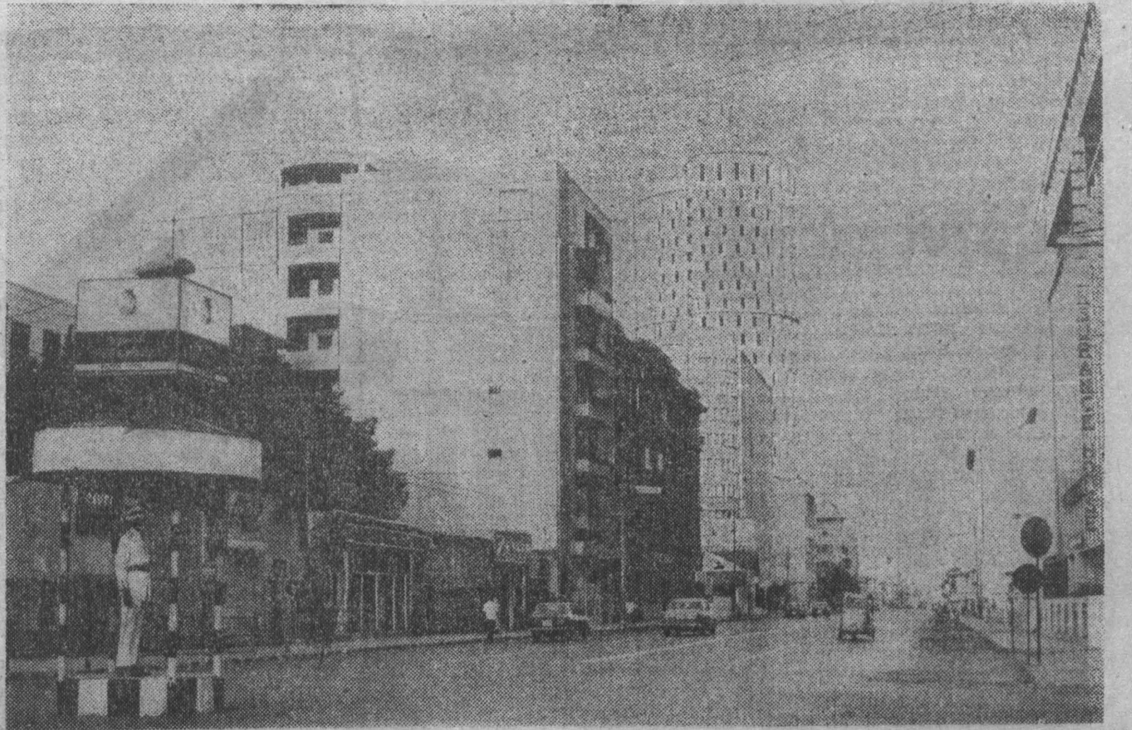
14 августа Пакистан отмечает 23-ю годовщину своей независимости. За эти годы изменился облик страны, окрепла ее экономическая база. Большую помощь Пакистану оказывает Советский Союз, который поставляет ему различное оборудование, содействует развитию собственной промышленности Пакистана. НА СНИМКЕ: одна из центральных улиц Карачи — Маклеудроуд.

неткам пришлось вычеркнуть из личных списков своих дивизий 230 тысяч человек... Чувствуя шаткость своих позиций, агрессоры решили дополнить доктрину «вьетнамизации» так называемой программой «умиротворения». Если отбросить этот «голубиный» термин, то становится ясным, что речь идет о политике репрессий и террора, нацеленной на физическую ликвидацию сил, находящихся в оппозиции к сайгонскому режиму. Недавняя конференция представителей народов Камбоджи, Лаоса, ДРВ и Южного Вьетнама, — сказала в заключение Нгуен Тхи Бинь, — явилась важной политической встречей, которая определила роль отдельных патристических движений в общей борьбе народов Индокитая против американской агрессии. Эта борьба будет продолжаться до тех пор, пока Индокитай не станет зоной независимости и мира. В. СИМОНОВ, соб. корр. АПН. Дели, август.