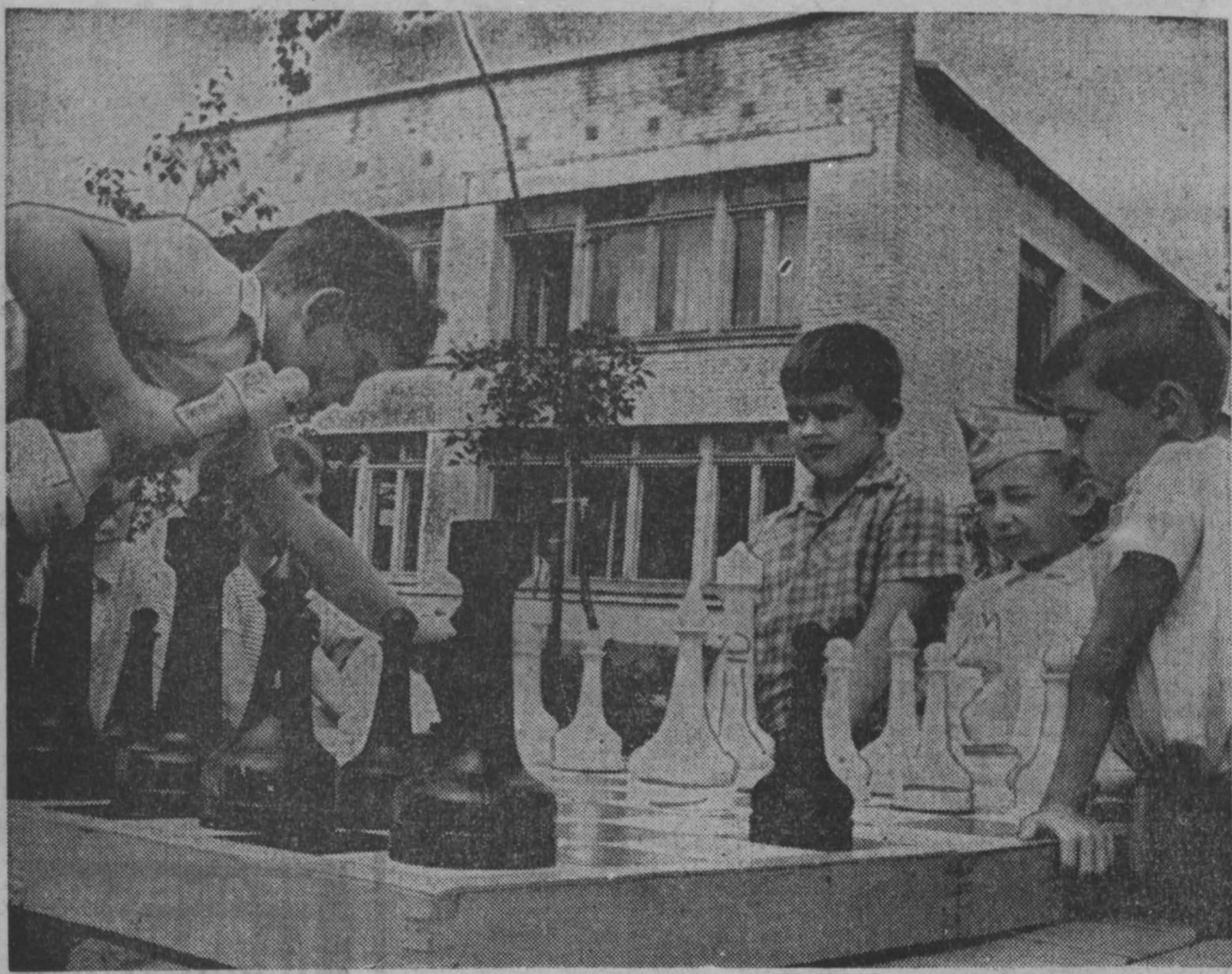
Обучение правилам шахматной игры, приобретение практических навыков в ней входит в программы некоторых высших и средних учебных заведений нашей страны.

Стремлением как можно раньше приобщить ребят к шахматам продиктован эксперимент, проводимый ныне в детском саду № 443 Перовского района Москвы. Здесь введены еженедельные занятия шахматами, для которых привлечен опытный инструктор. Эти занятия, проводимые с учетом возраста и пола ребят, показывают, что дошколята очень быстро усваивают правила и проявляют к шахматам большой интерес.