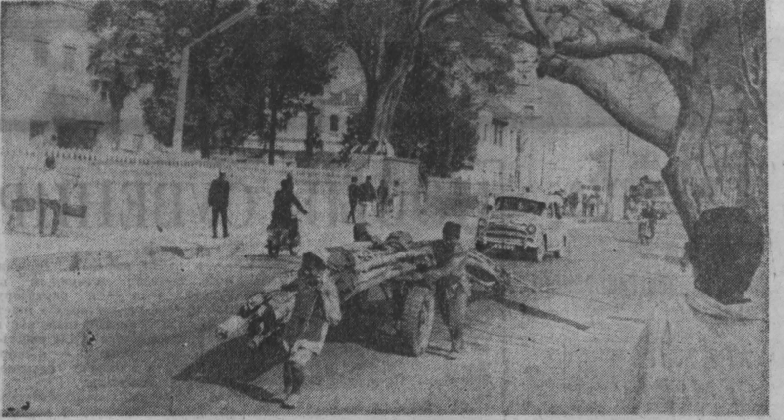
● НЕПАЛ. На улицах Катманду. Перевозка длинных стволов бамбука часто производится таким примитивным способом.