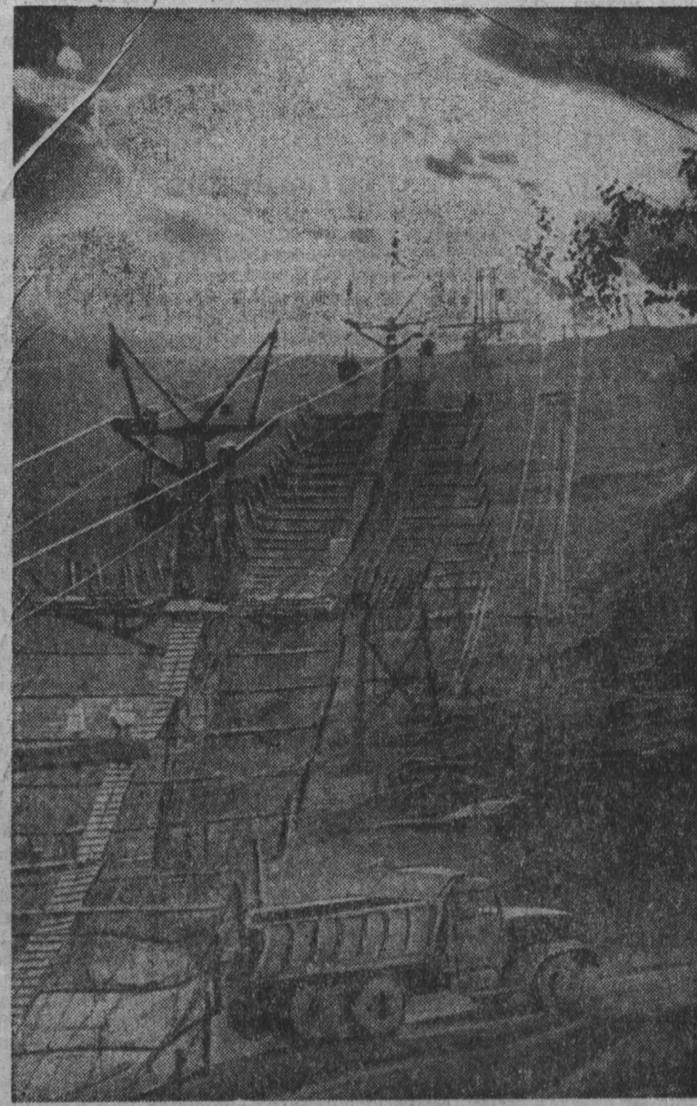
Ни днем, ни ночью не прекращается движение на канатной дороге, по которой добывается железная руда доставляется на Шерегешскую обогатительную фабрику. Коллектив, обслуживающий дорогу, всегда содержит ее в исправном состоянии.

УВЕРЕННЫЙ ШАГ Управление № 3 треста «Строймеханизация-2» выступило инициатором социалистического соревнования в честь XXIV съезда КПСС. Механизаторы решили досрочно завершить план пятилетнего года и выполнить задание первого квартала 1971 года к 20 марта, повысить производительность труда против плановой на 1 процент, за счет внедрения рационализаторских предложений и новой техники добиться экономического эффекта на сумму 63 тысячи рублей, снизить себестоимость строительных работ против планового задания на 0,5 процента. А. СУВОРОВ. г. Кемерово.