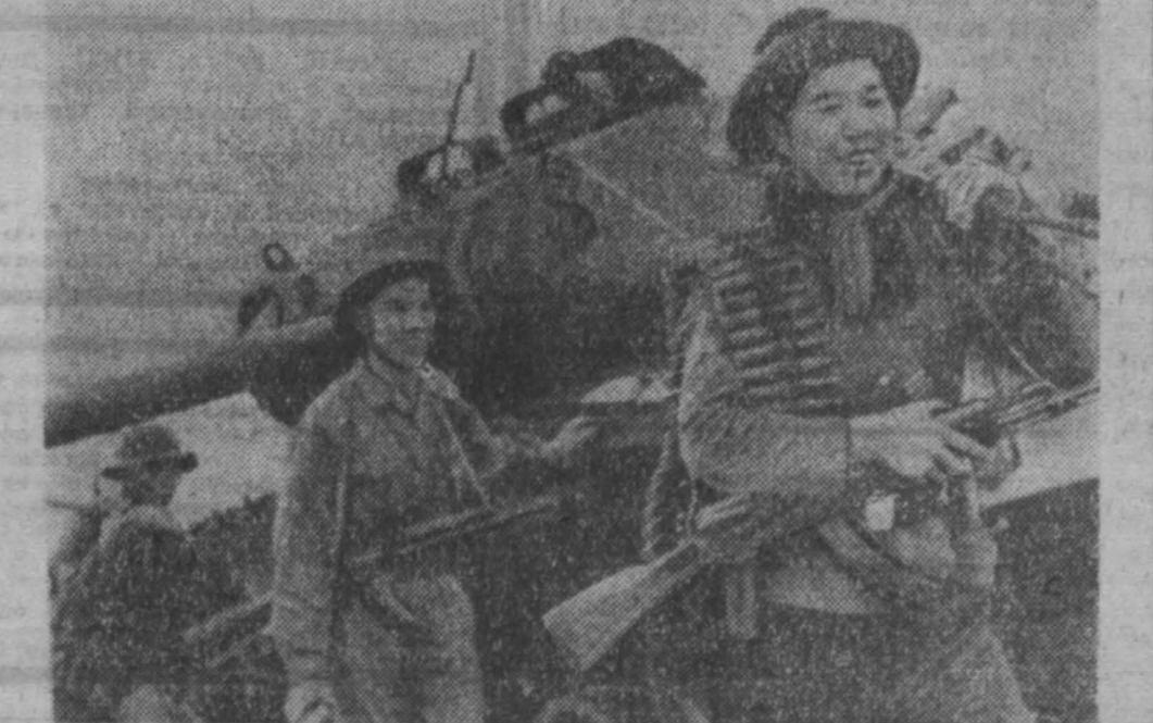
Народные вооруженные силы освобождения продолжают вести успешные боевые действия по всей территории Южного Вьетнама, нанеся американско-сэйгонским войскам тяжелые потери в живой силе и технике. НА СНИМКЕ: южновьетнамские патриоты после осмотра подбитого ими американского танка возвращаются с трофеями на поле боя.