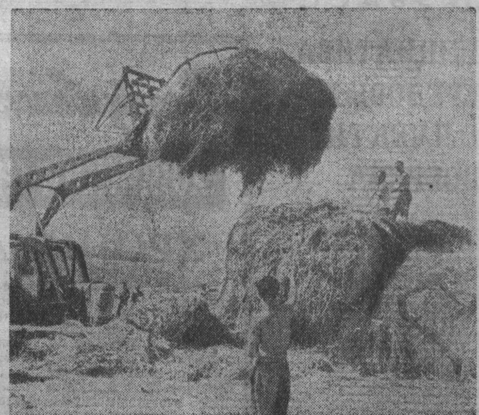
На третьей ферме совхоза «Трудармейский» ударно трудятся на сенокосе работники механизированного отряда и конно-ручных звеньев. Они заготовили сена около 300 тонн из 438 тонн по плану.