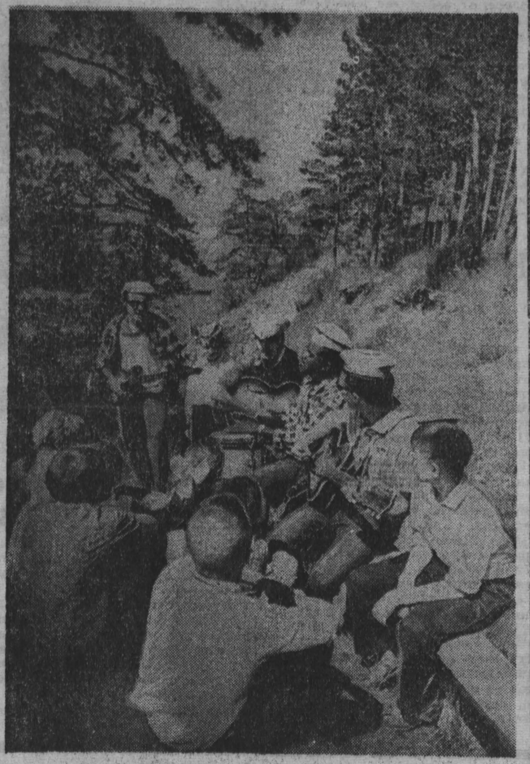
наз остановилась машина Фиделя, и он пригласил нас сесть рядом, долго расспрашивал обо всем.

ем мы и вождей кубинской революции — Фиделя Кастро, Эрнесто Че Гевары, Освальда Дортикоса. Звучные, непривычные нашему уху слова: Сьерра-Маэстра, Сантьяго-де-Куба, Гуантанамо, барбудос, милисиано — входили в наш словарь.