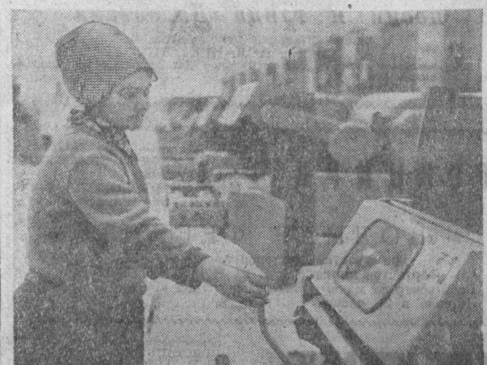
РОСТОВСКАЯ ОБЛАСТЬ. Вступила в строй первая очередь Донецкой хлопкопрядильной фабрики...