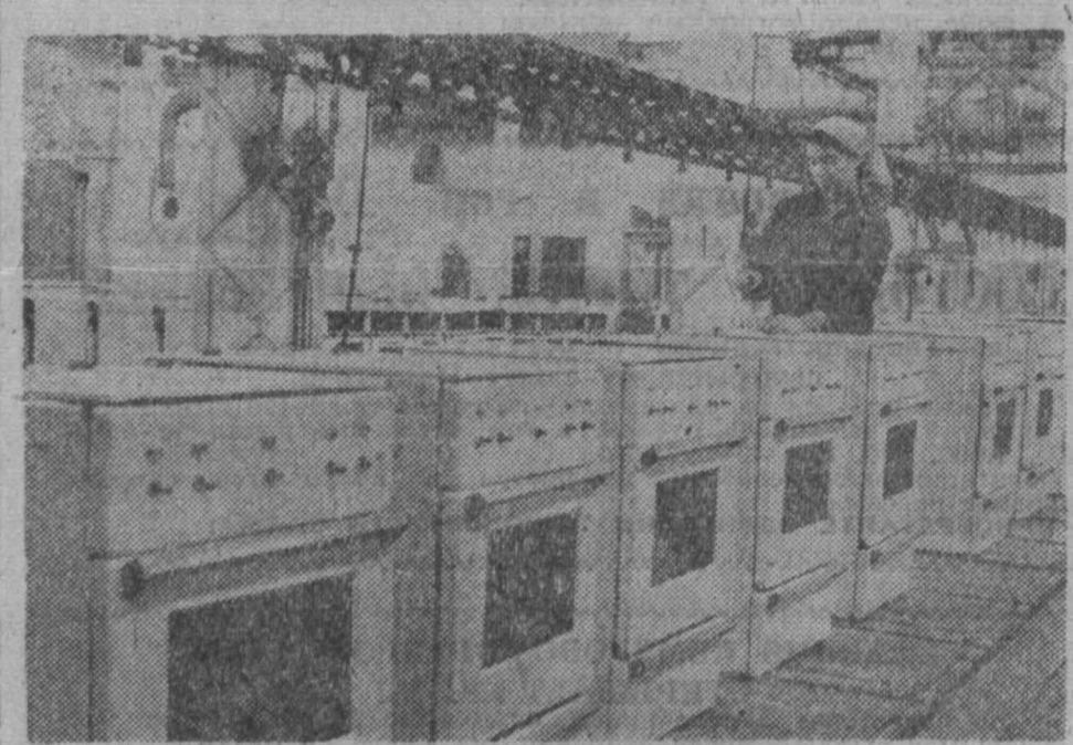
АЗЕРБАЙДЖАНСКАЯ ССР. С конвейера Бакинского завода газовой аппаратуры сошла первая партия излучающих стабилизаторов...