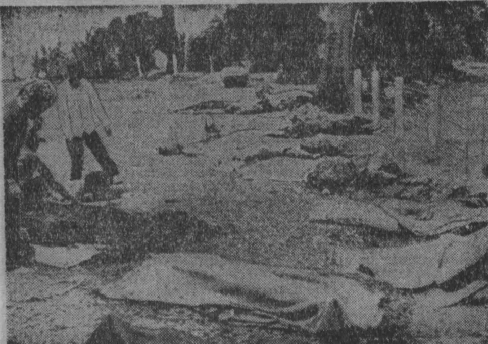
То, что вы видите на снимке, — не Америка, но это имеет прямое отношение к геологической Америке, которая взяла на себя роль мирового зеркала. НА СНИМКЕ: последствия американско-саigonской интервенции в Камбоджу (провинция Свайриен). Фото ВИА—ТАСС.

А. ПАНИРО, кандидат экономических наук (АПН).