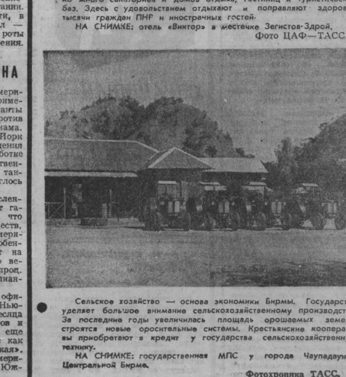
Сельское хозяйство — основа экономики Бирмы. Государство уделяет большое внимание сельскохозяйственному производству. За последние годы увеличилась площадь орошаемых земель, строятся новые оросительные системы, крестьянские кооперативы прибегают к кредит у государства сельскохозяйственную технику. НА СНИМКЕ: государственная МПС у города Чаупадаун в Центральной Бирме.