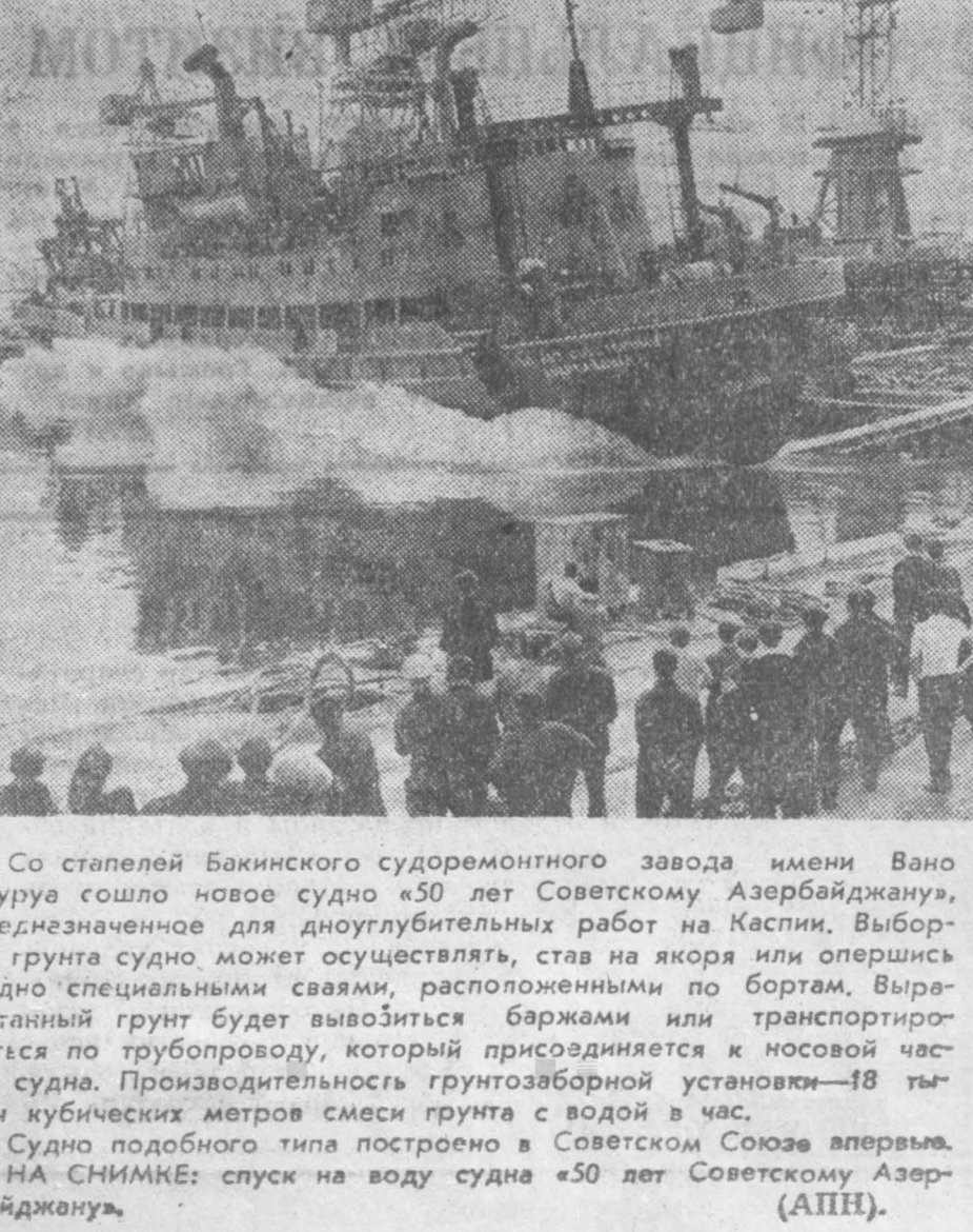
Со стальной Балниского судостроительного завода имени Вано Стурца сошло новое судно «50 лет Советскому Азербайджану», предназначенное для дислоцированных работ на Каспии. Выходу судна может способствовать, став на якоря или опершись в дно специальных сваями, расположенными по бортам. Выработанный грунт будет вывозиться баржами или транспортироваться по трубопроводу, который присоединяется к носовой части судна. Производителем грунта-основания — 18 тысяч кубических метров смеси грунта с водой в час.