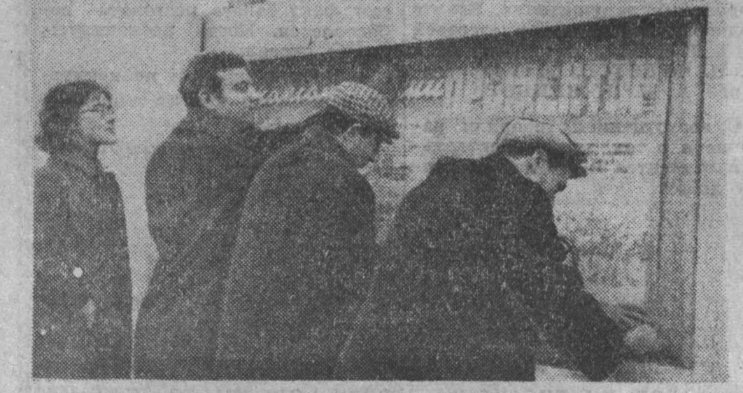
Через минуту — две, как только будет пригласен на стенде очередной выпуск «Комсомольского прожектора», сюда соберется много народа. Острые строки, меткие и выразительные карикатуры будут в цель.