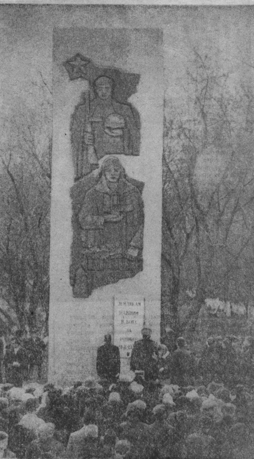
8 мая в Прокопьевске на улице Артемовской состоялось открытие обелиска в честь земляков, павших в битвах с немецко-фашистскими захватчиками. Бывшие фронтовики и будущие солдаты — призывники возложили к подножию обелиска венки.

Востынку так. А. ВОЛОШИН, писатель, г. Кемерово.