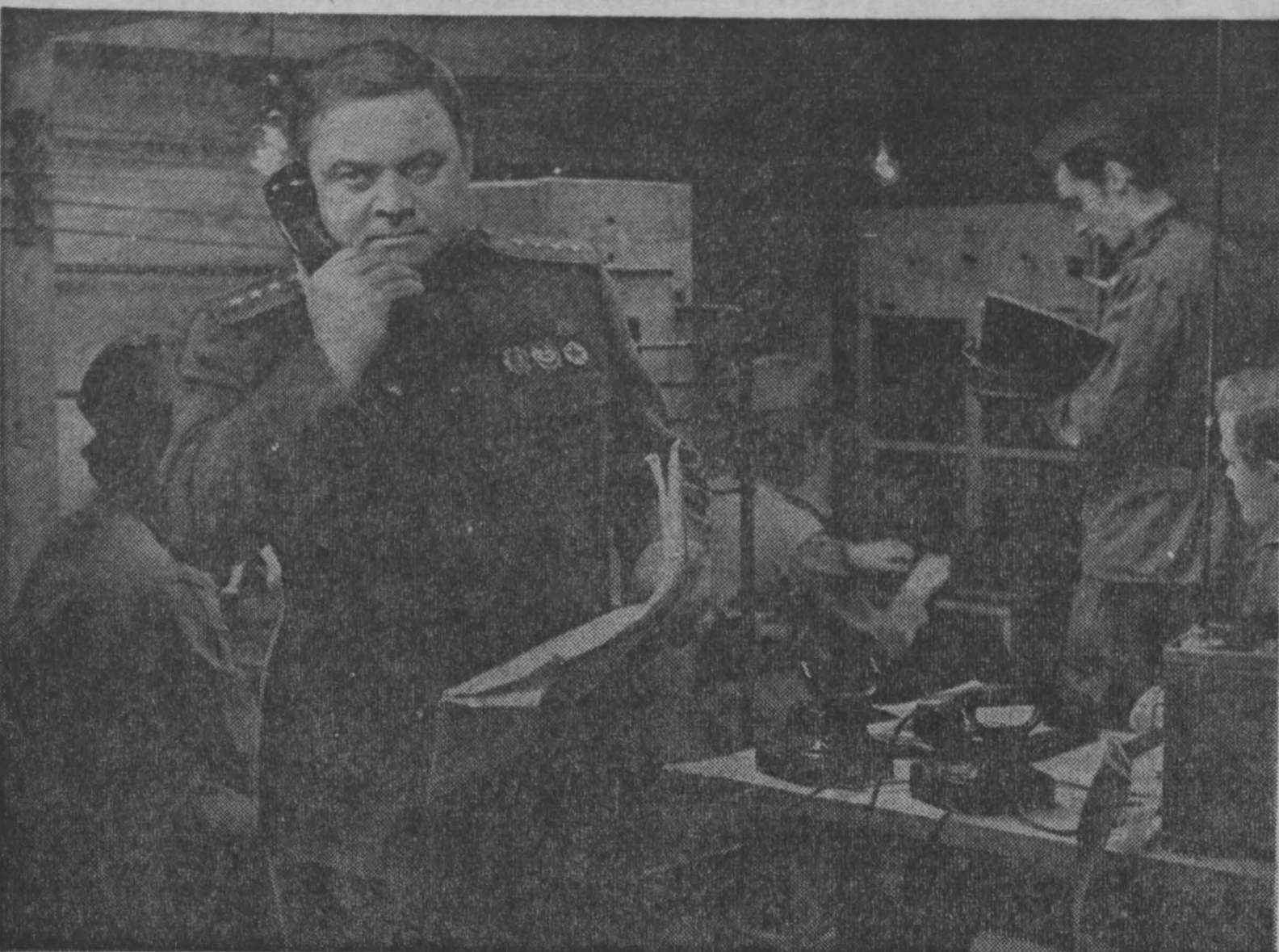
МОСКВА. На экранах вышли два первых фильма из многосерийной киноэпопеи «Своё поколение»...