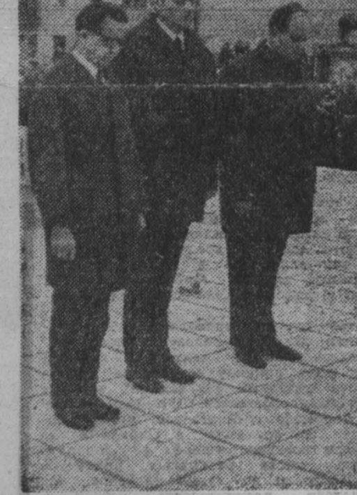
НА СНИМКЕ: гости из ГДР возложили цветы.

В. В. Листов сообщает, что исполком городского Совета депутатов трудящихся принял предложение городской комсомольской организации об установлении в память героя почетного комсомольско-пioneрского поста. Секретарь горкома ВЛКСМ