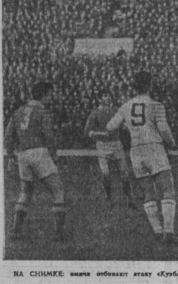
НА СНИМКЕ: омичи отбивают атаку «Кузбасса»

Счет 1:0 в пользу хозяев поля повторился трижды. Кроме Кемерово, такой