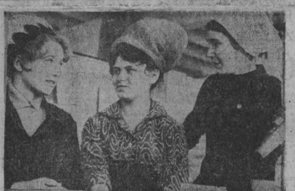
Коллектив комсомольско-молодежного участка сборки галловых реле цеха № 1 Кемеровского электротехнического завода считает одним из лучших. Здесь добиваются высоких производственных показателей, отличного качества продукции. Сейчас коллектив участка обсуждает, что необходимо сделать во время ленинского субботника.