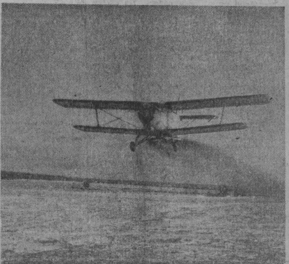
СМОЛЕНСКАЯ ОБЛАСТЬ. В совхозе «Родоманово» с каждого гектара получают по 23 центнера зерна и выполнили пятилетний план по продаже хлеба государству. За успешное проведение уборки урожая и сверхплановую продажу зерна государству в 1968 году совхозу присуждено переходящее Красное знамя Совета Министров РСФСР и денежная премия. Сейчас труженики хозяйства готовят к весне. На поля вывозят органические удобрения, минеральные вносят с помощью авиации (на снимке).