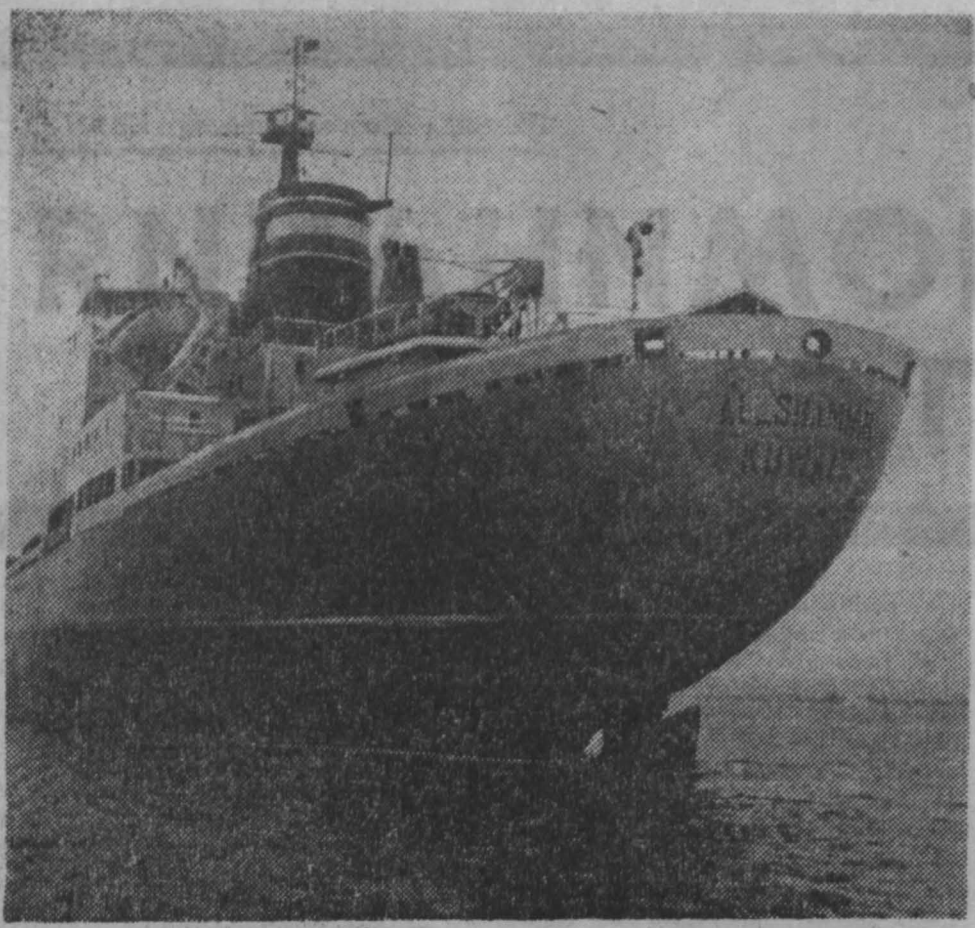
Судоустановочные суда, построенные на стапелях Черноморского судостроительского завода в городе Николаеве...

Мы надеемся, что, прочитав эту заметку, посланцы Ленинграда или их дети откликнутся и подробнее расскажут о том, как рабочие города, носящего имя Ильича, пришли на помощь трудовому Кузбассу.