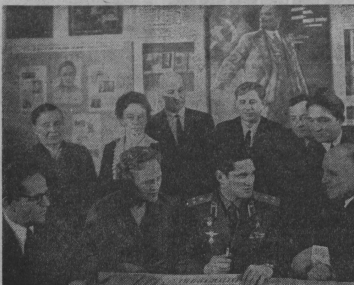
Космонавт-14 в классе со своими бывшими одноклассниками и учителями.