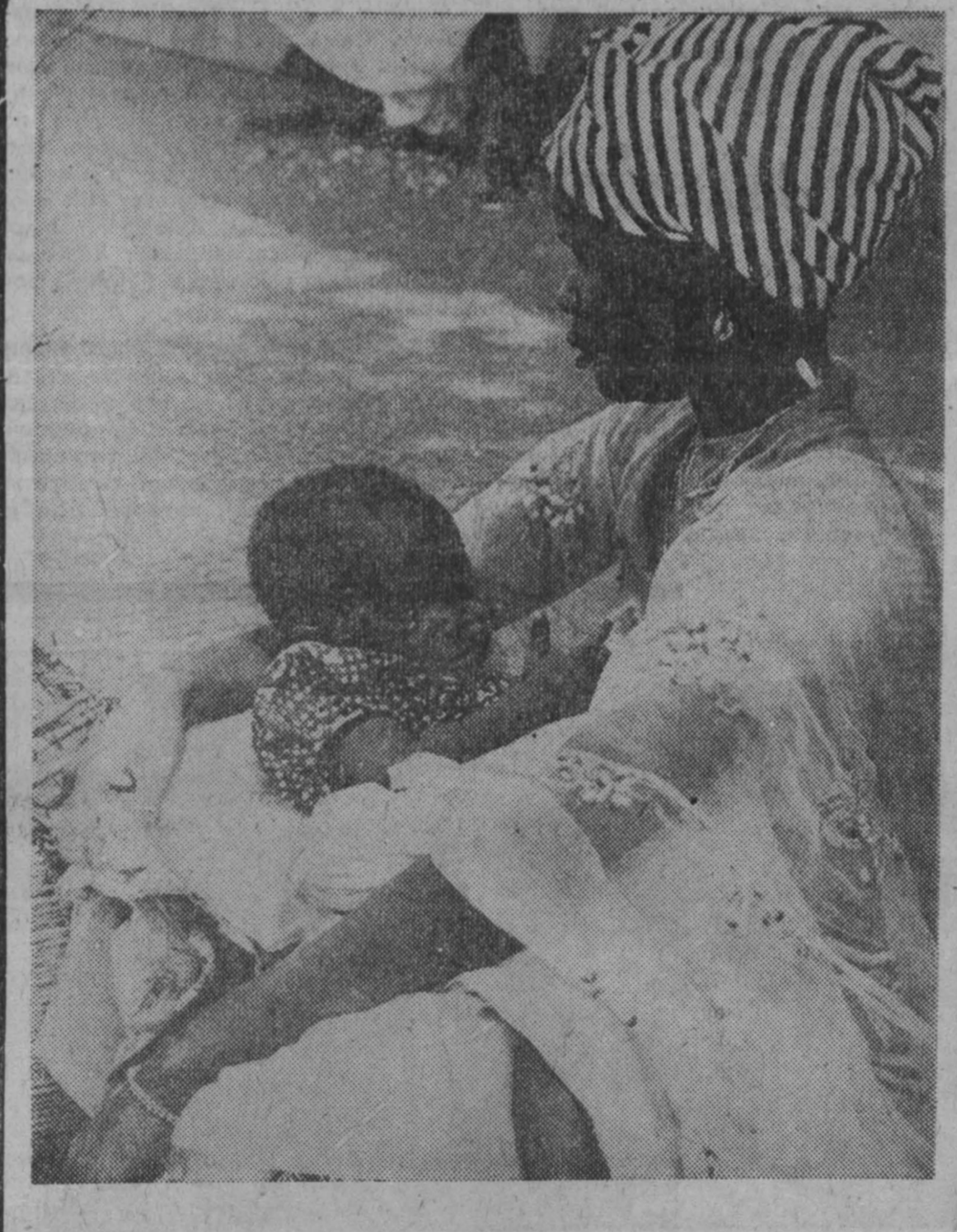
Слепая матъ