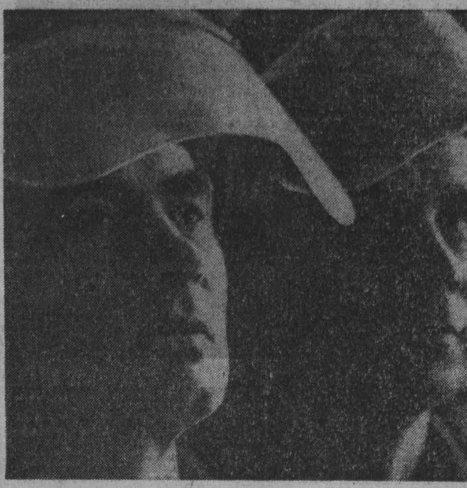
Коллектив электротермического цеха на Беловском цинковом заводе небольшой. Но именно он выдал наибольшее количество цинка. И выход металла из рудного концентрата здесь самый высокий. Он равен 91 проценту. Коллектив электротермического цеха выиграл победителей в соревновании среди цехов завода.

И еще о качестве. В готовящемся к сдаче в эксплуатацию бетонные полы выполнены небрежно, бетон уложен без виброрешетки, деревянные кормушки для телят выполнены из сырого нестроганого пиломатериала, качество крошки неудовлетворительно, так как цементная стяжка устроена в зимнее время «способом замораживания». Если в 1967 году к строителям этой мехколонны приезжали за опытом делегации с других областей, то нынче учиться здесь нечему. Строительные конструкции и материалы используются, как правило, бракованные. Так, в 22-квартирном доме № 3 Зерубинского совхоза наружные стеновые панели смонтированы с трещинами. Половая рейка и шкафы деревянные изделия выполнены из сырого материала.