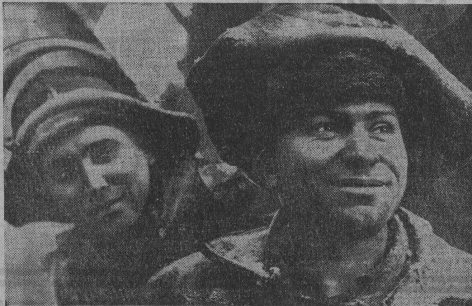
В минувшем году доменная печь № 1 Запсиба дала стране более 45 тысяч тонн первострочного чугуна сверх плана.