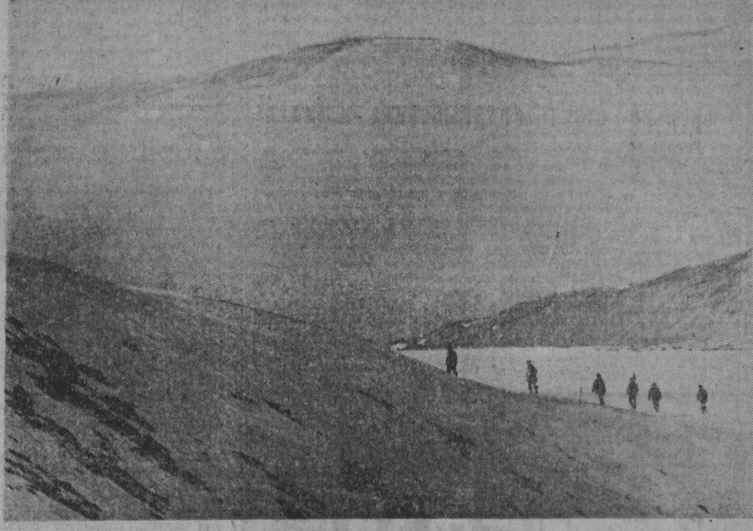
КАНЫМ. Геологи всегда в пути. Их путь далек и долг. НА СНИМКЕ: разведчики Терсинской партии Толь-Усинской экспедиции на горных маршрутах.

«Конфеты»... на деревьях Субтропическая Азербайджанская сахарная страна, но в горах Талыш, растут «конфетные деревья». Плоды их напоминают внешним видом настоящие батончики, имеют вкус изюма и аромат рома. Эти конфеты-плоды растут на деревьях по дну талышских ущелий, собирающей сладости на деревьях, достигающих высоты 20 метров. «Конфетное дерево», называемое еще говейной, завезено в Азербайджан из субтропиков Китая. Оно хорошо прижилось и дает неплохой урожай — до 40 килограммов буровато-красных плодов. Плоды содержат до 47 процентов сахара и много витаминов. Они употребляются в свежем и переработанном виде, используются в кондитерской промышленности. «Конфетное дерево» — одно из многих редких растений, произрастающих в субтропиках Азербайджана. На склонах Талышских гор можно встретить деревья и кустарники свыше 200 видов, из которых 15 — реликтовые. Б. ДАМИНОВ, корр. ТАСС.