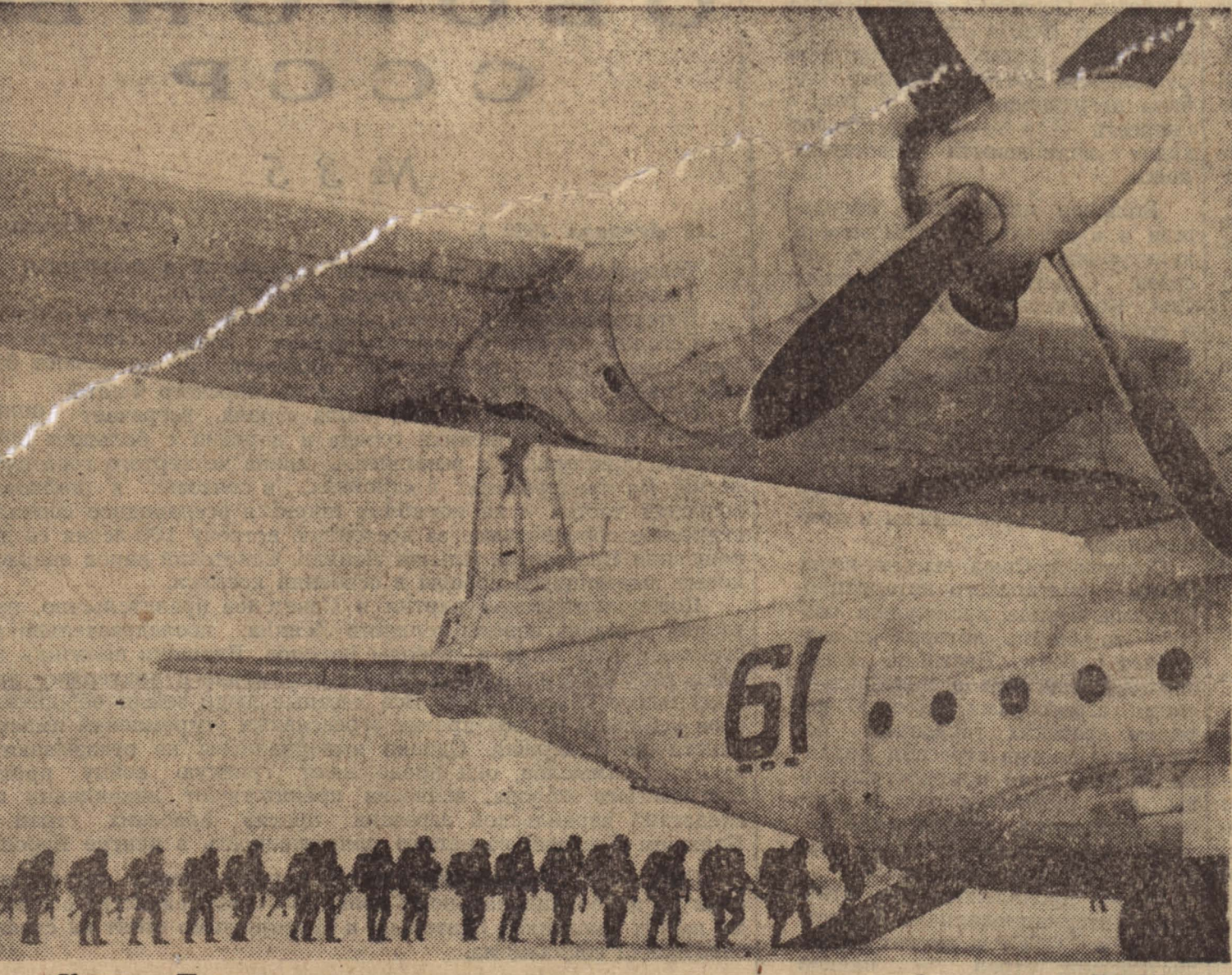
Учения. Посадка десанта в самолет.

В Красном о войне узнали только утром 23 июня. Не могла