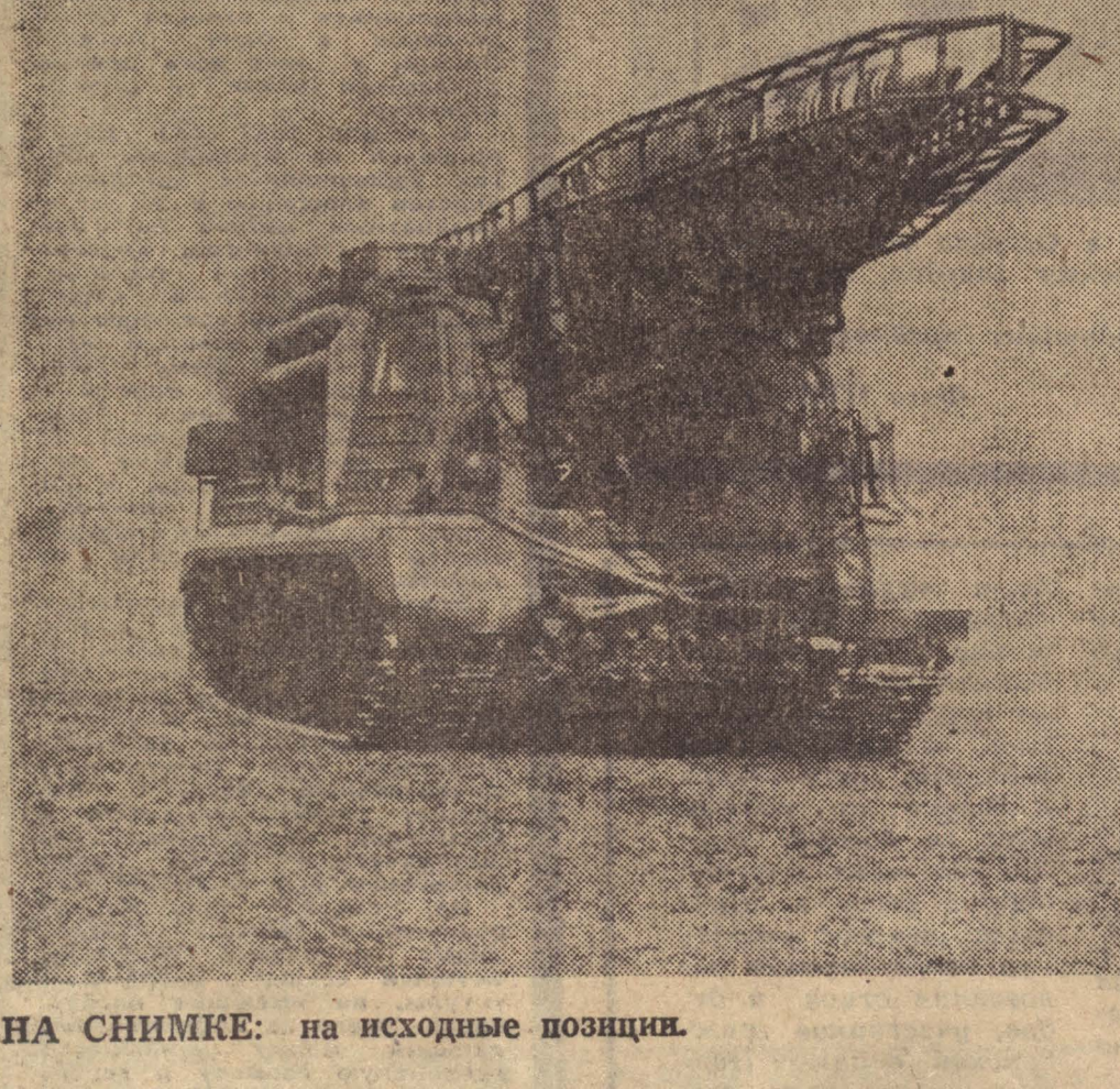
НА СНИМКЕ: на исходные позиции.

Мы будем достойны своих отцов! Курсант Ю. БЕЛЕНКО.