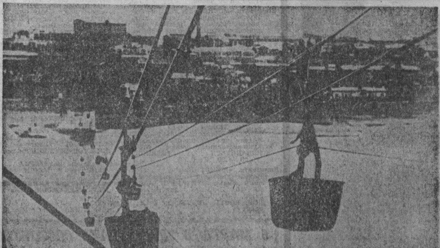
Конец 1923 года. На Кемеровском коксохимическом заводе сооружается мощная по тому времени коксовая батарея. И вот уже с правого берега Томи сюда доставляется уголь по новой подвесной канатной дороге.

В сентябре прошлого года рассказом о развитии энергетики Кузбасса мы начали публикацию тематических страниц «По заветам Ильича». Цель этих публикаций — на примере родного края и его людей показать торжество идей ленинизма, осуществление заветов В. И. Ленина. В газете помещались документы, написанные Ильичем, в которых речь шла о Кузбассе, напечатаны воспоминания старых большевиков, письма трудящихся области Владимиру Ильичу в 1920—23 годах. Редакция подготовила очередную страницу. В ней использованы новые материалы, найденные сотрудниками областных партийных и государственных архивов Кемерово, Томска и Новосибирска, а также советом научных работников при редакции газеты «Кузбасс».