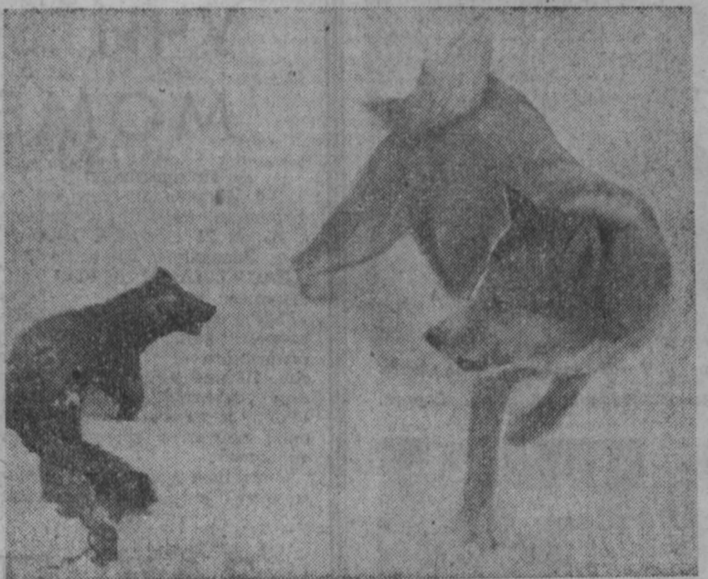
Лопаточкой стал под ним выбирать снег. Димчик готов. Крышка — тонкий снежный покров с отпечатком следа. А жить в домике будет гичичный халчан с разведенными стальными челюстями. Его пока сквозит снег видно. Темнеет что то черное, лавещее. Но это лямки быстро исчезает. Все вокруг закрыт снегом, и все вдруг приобретает обычную перуозданную картину. Ни за что не догадывается зверек, что под карауливает его на этой тропке смертельная опасность.

Поставить капкан — это еще даже не подела. Следов тма. И по какому из них пойдет во второй раз соболя, сказать ни-