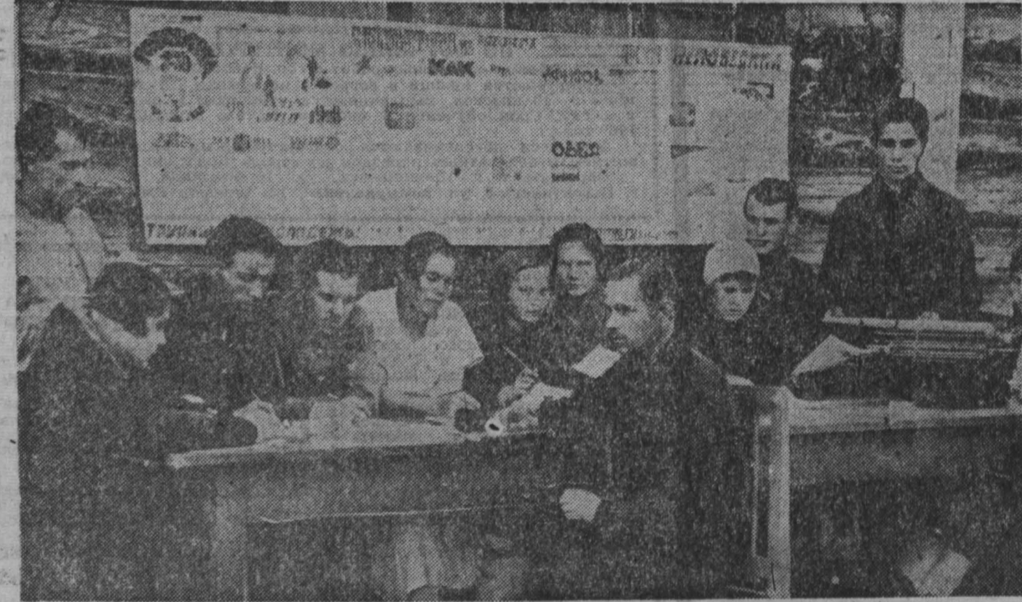
Стенную газету мы сейчас встречаем на каждом предприятии, в каждом учреждении, учебном заведении Кузбасса. Выть может, стенгазета «Горнущика», издаваемая на Кемеровском руднике в 1921 году, и была прародительницей сегодняшних «Забойщиков», «Верстаков», «Электромоторов», боевых производков ленинских идей в массы.