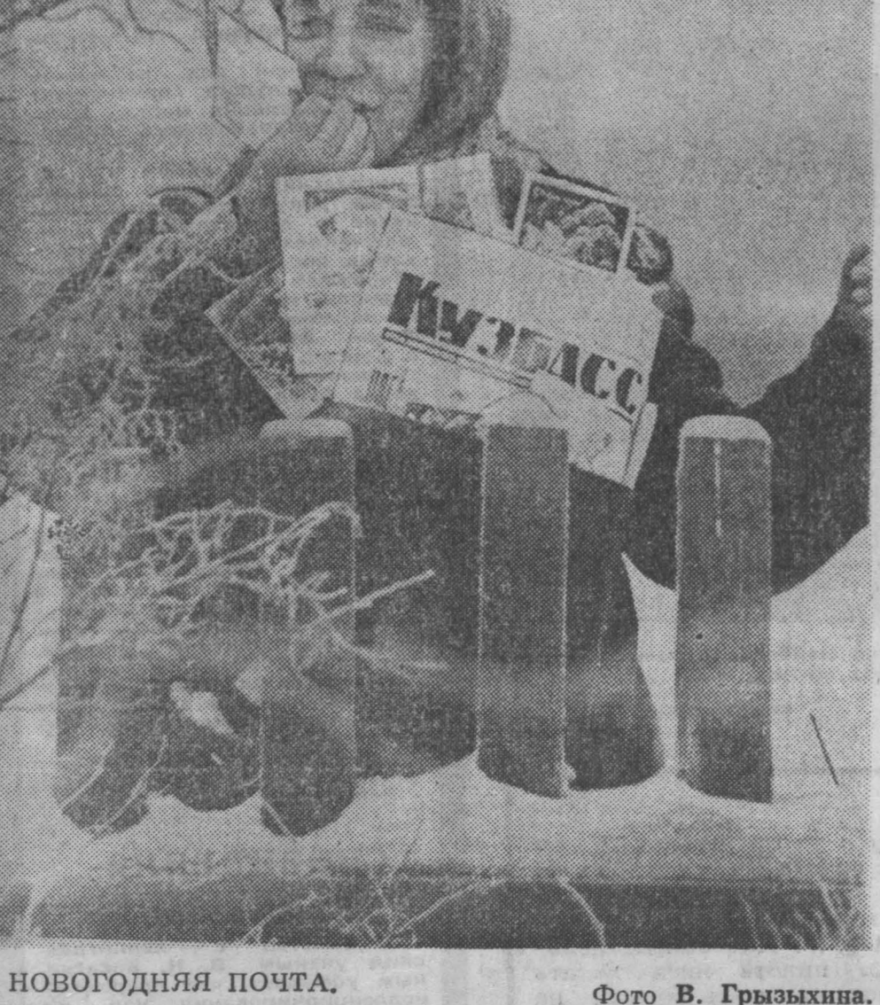
НОВОГОДНЯЯ ПОЧТА.