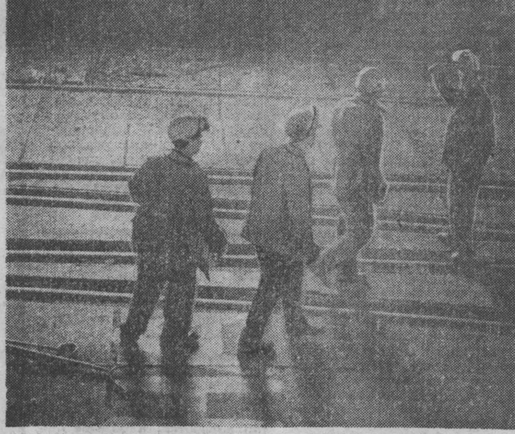
Вот-вот в сталелитейном производстве Запсиба вступит в строй действующий новый мощный агрегат — конвертор № 3. А пока что идет горячее его опробование в сталевозных новинках — пробная сталь.