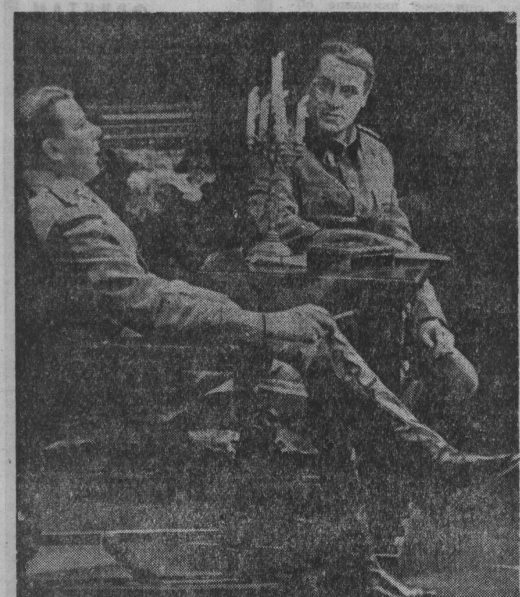
«СЕМНАДЦАТЬ МГНОВЕНИЙ ВЕСНЫ» — новый спектакль Кемеровского областного театра драмы имени А. В. Луначарского.

100-летие со дня рождения В. И. Ленина наша страна, советское учительство встречают, решая новые важные задачи в совершенствовании народного образования.