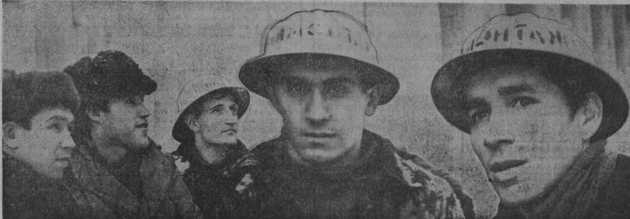
Они — монтажники-высотники. Да еще какие! Полторы — две нормы в смену! Так работала бригада на конверторном цехе Запсиба.

ГОСУДАРСТВЕННАЯ КОМИССИЯ ПОДПИСАЛА АКТ О ПРИЕМЕ В ЭКСПЛУАТАЦИЮ КОНВЕРТОРНОГО ЦЕХА ЗАПСИБА