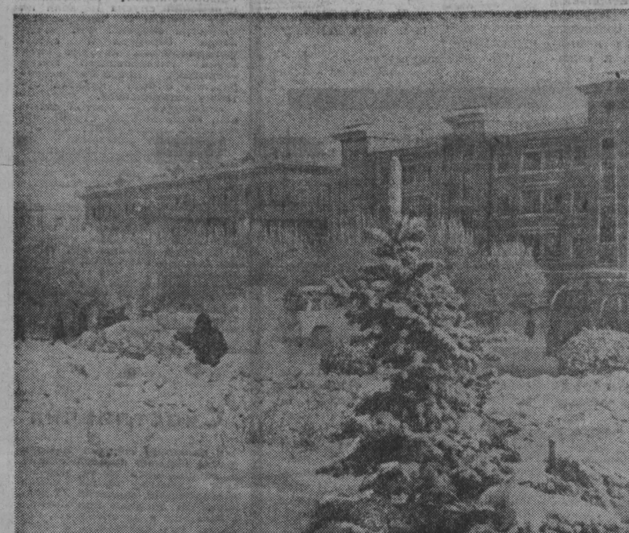
КЕМЕРОВО ЗИМОЙ.

О шести матчах чемпионата страны по хоккею с мячом, состоявшихся в воскресенье 2 февраля, сообщают корреспонденты ТАСС: СКА (Хабаровск) — «ВОДНИК» (Архангельск) — 2:1. Армейцы вышли на лед с явным желанием издать ревущий рев. Счет в пользу гостей в первом круге. За грубую игру судьи вынуждены были четыре раза удалить с поля игроков «Водника» и дважды назначать в ворота гостей 12-метровые. «ЛОКОМОТИВ» (Иркутск) — СК «УРАЛЬСКИЙ ТРУБИЛЬНИК» (Перевурьяльск) — 3:4. После первого тайма, прошедшего при подавляющем преимуществе гостей, неслыханный доминирование, отдохнувшая во второй половине заметно активизировалась. Однако игра уже была сделана, и отыграться у них просто не хватало времени.