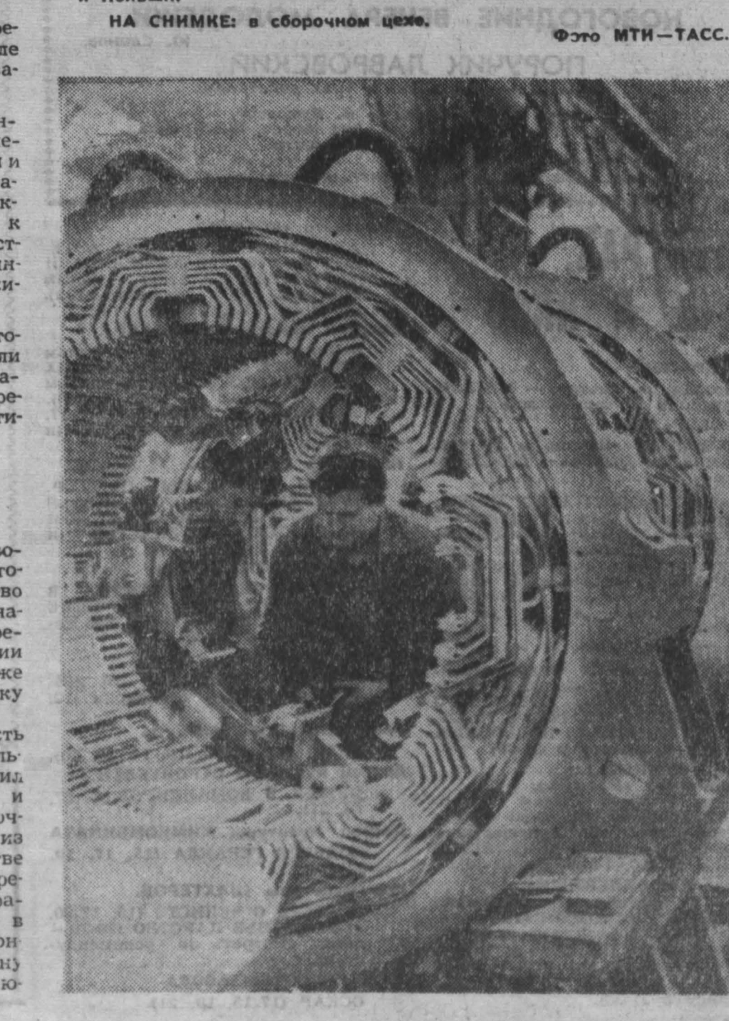
Значительная часть продукции будапештского завода «Ганца» составляет предмет экспорта. Большим спросом в братских социалистических странах пользуются электромоторы и генераторы новых типов. Сейчас предприятие выполняет заказы ГДР, Болгарии и Польши.

ле и технике. 16 декабря партизаны обстреляли из минометов израильские военные автомашины близ поселения Кефар-Руфия. Убито несколько израильских солдат.