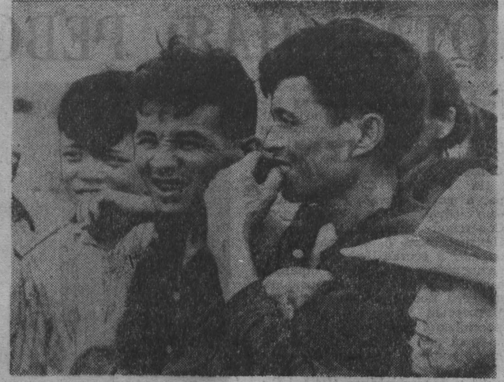
ЮЖНЫЙ ВЬЕТНАМ. Эти люди остались в живых после варварского истребления жителей деревни Сонги американскими солдатами. Снимки убитых запрещены для публикации Пентагоном.

БУДАПЕШТ, 10 декабря. (ТАСС). Зима в Венгрии пришла всего лишь несколько дней назад, но она сразу заявила о себе, в первые же дни побив рекорды многих лет. Сообщения о погоде в стране ныне напоминают боевые сводки. Снежная стихия особенно разбухала в западной и юго-западной частях Венгрии. Вчера в ряде областей частично или даже полностью прекратилось движение транспорта. Снежные заносы высотой до 3-4 метров держат в плену многие сотни автомашин, железнодорожные поезда часами простаивают на перегонах. Из области Тольна сообщают, что кое-где под снегом скрылись верхушки телеграфных столбов. Многие населенные пункты отрезаны от внешнего мира, с сотнями сел прервана телефонная связь. Население и подразделения венгерской Народной армии прилагают огромные усилия по ликвидации последствий снежных бурь.