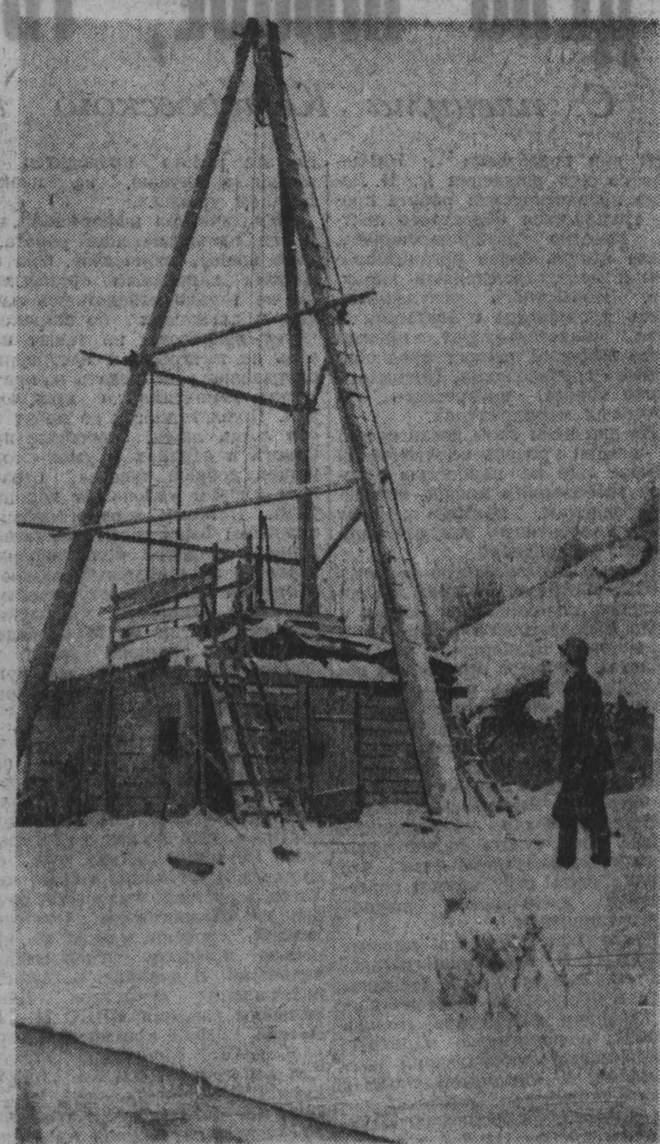
Почти четверть века ведет разработку угля в районе Междуреченска коллектив Усинской геологоразведочной экспедиции. Начали геологическую работу на этом месте. А сейчас здесь версты мощные современные шахты, карьеры. Казалось, что за эти годы можно установить всю картину залегания пластов. Но и сейчас еще геологи открывают новые запасы топлива. Коллектив экспедиции ведет учет

Собрание актива приняло постановление по обсужденному вопросу.