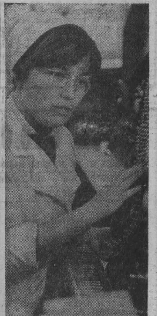
ТАТАРСКАЯ АССР. Во все концы Советского Союза и многие зарубежные страны отгружает Казанский металлургический завод миллионы метров китей для шивания тканей при хирургических операциях. Коллектив амальгамного цеха обязался к концу года дать медицинским учреждениям страны дополнительно к плану 100 тысяч ампул с ленту-том.